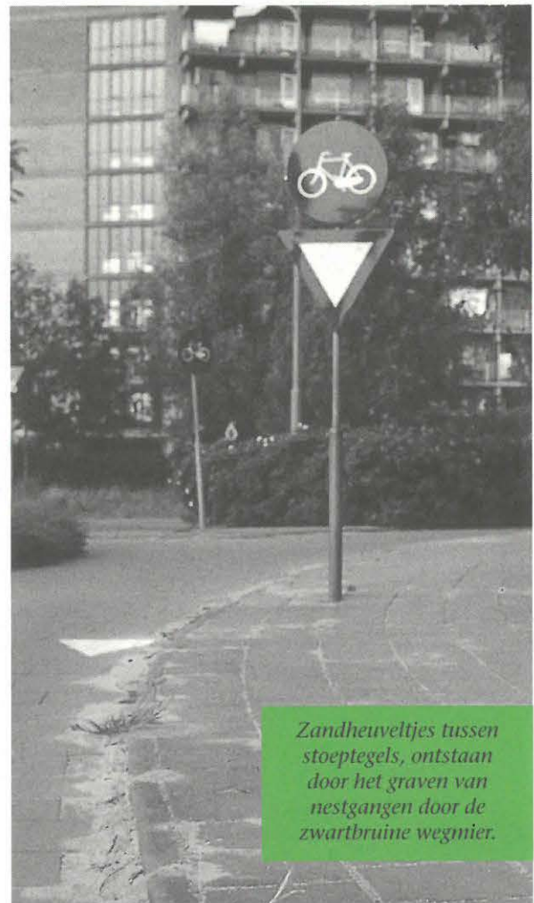
Zandheuveltjes tussen stoepetegels, ontstaan door het graven van nestgangen door de zwartbruine wegmier.

In Leiden heeft een nauwverwante soort enkele straten in bezit genomen. Een dergelijk massaal optreden is zeldzaam en wijst op het voorkomen van volken die dochternesten kunnen afsplitsen. Dit kan alleen als ze verscheidene koninginnen bezitten.