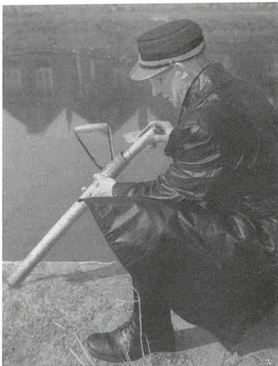
Rattenbestrijding met gaspatronen

te dwingen tot noodzakelijke reparaties of verbeteringen. De eigenaar stort een waarborgsom en Gemeentewerken zorgt voor de uitvoering van herstellingen aan defecte huisaansluitingen op de riolen, daar particulieren niet aan de openbare straat mogen werken