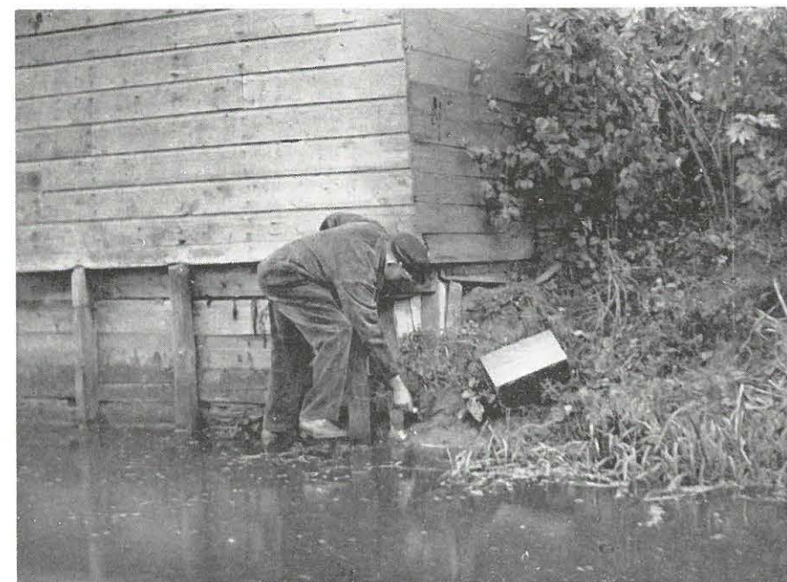
Uitleggen van lokaas

Wanneer de behandeling met gif is geëindigd en met de huiseigenaar geen overeenstemming kan worden bereikt voor het treffen van voorzieningen in verband met de ratwering, wordt Bouwen Woningtoezicht ingeschakeld, welke dienst de middelen heeft om de eigenaar