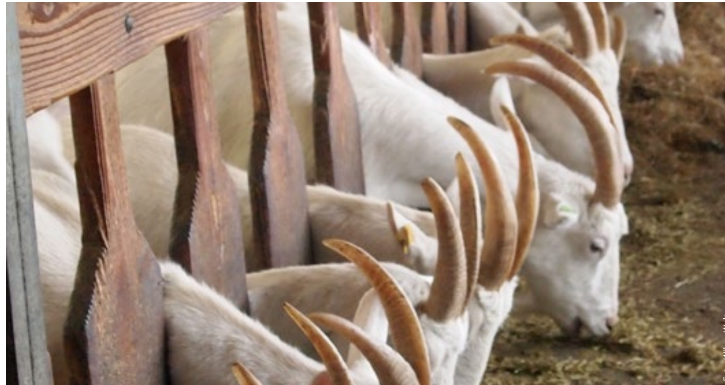
Een onderwerp dat niet nu direct speelt, maar dat de Groene Geit wel in de gaten houdt, is hoorns op de geiten.

wel kon halen. Je krijgt bijvoorbeeld punten voor een geïsoleerd dak, maar biologische geitenhouders weiden hun geiten en weinigen hebben een geïsoleerd dak. En met een uitloop zou je het maximaal aantal punten kunnen halen, maar dat is nog geen weidegang. Dus onderscheid is hier gerechtvaardigd.”