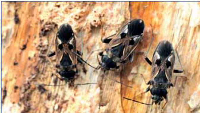
Rhyparochromus vulgaris .

Wantsen worden met enige regelmaat in huis aangetroffen. Naast soorten die daar thuishoren als de gemaskerde roofwants Reduvius personatus (L. 1758) en de bedwants Cimex lectularius (L. 1758), kunnen dat een aantal andere soorten zijn.