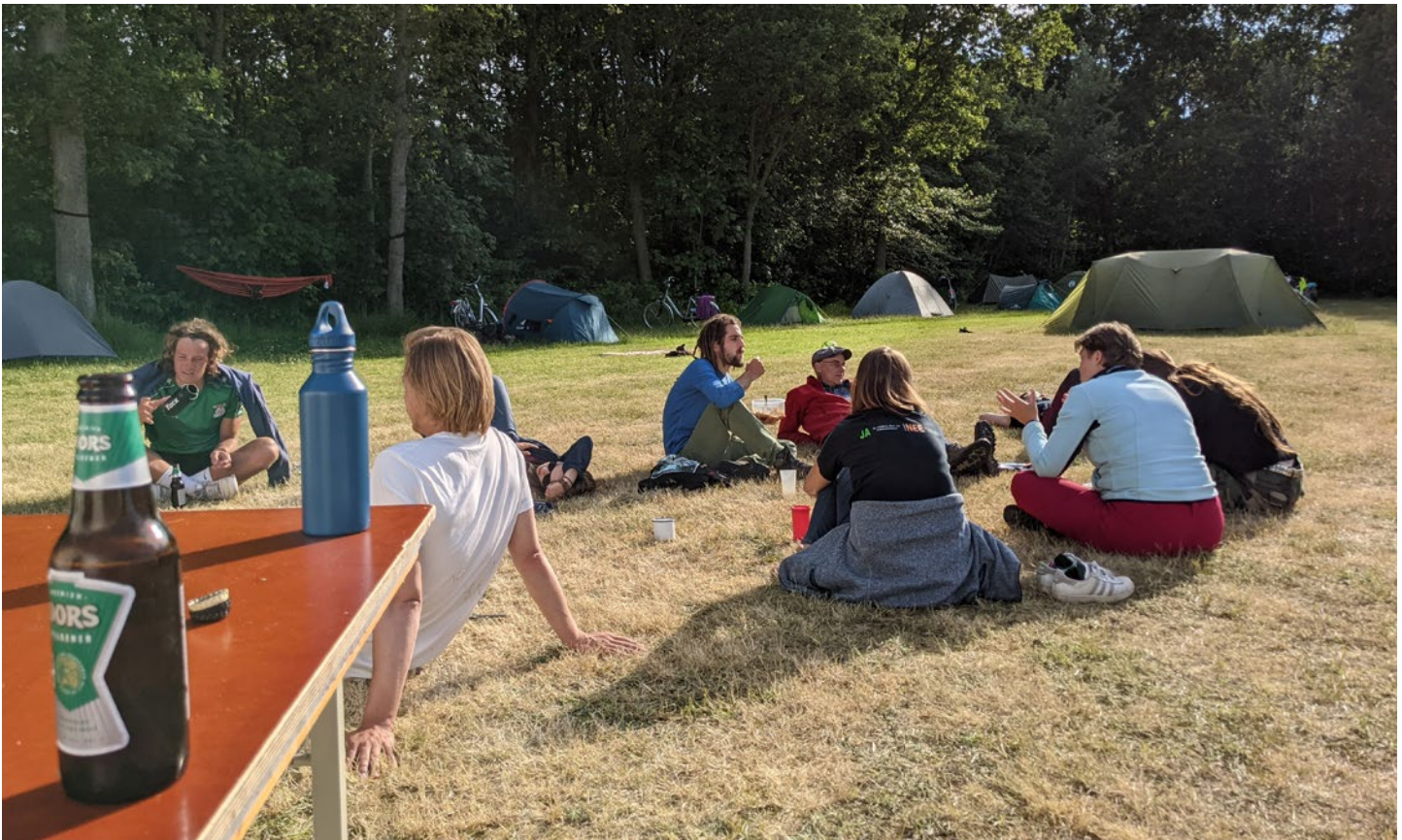
Ook het sociale aspect is belangrijk, zoals een borrel op de camping.

Van den Bosch: ‘Er is maandenlang gewerkt om dit goed te regelen. Niet alleen op onderwijsgebied, maar ook in verband met corona.’ Grosscurt vult haar aan: ‘Het is gaaf om dit mee te mogen maken. We zijn de docenten erg dankbaar.’ ■