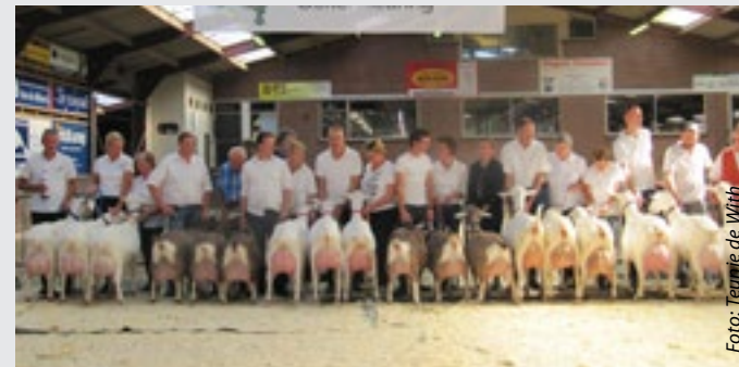
In 2019 werd voor het laatst een Landelijke keuring gehouden.

Het NOG-bestuur ziet er na rijp beraad vanaf om in september een nationale keuring te organiseren. Reden is dat de Stichting Landelijke Geitenkeuring (SLG) in augustus een landelijke keuring wil houden. Het NOG-bestuur is van mening dat twee landelijke keuringen binnen één maand niet wenselijk is. Daarmee zijn de individuele fokkers niet gediend. In het najaar gaan het NOG-bestuur en de SLG om tafel om dit soort misverstanden in de toekomst te voorkomen.