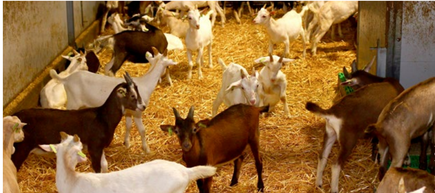
Bokjes op het eigen bedrijf laten opgroeien, zou rendement kunnen opleveren.

Bokjes houden is nog steeds een grote uitdaging voor de geitenhouderij. Het investeren in oplossingen voor de bokken staat nog niet bij iedereen op het prioriteitenlijstje, maar veel geitenhouders staan open voor suggesties en vinden het belangrijk dat bokjes voor humane consumptie worden gebruikt.