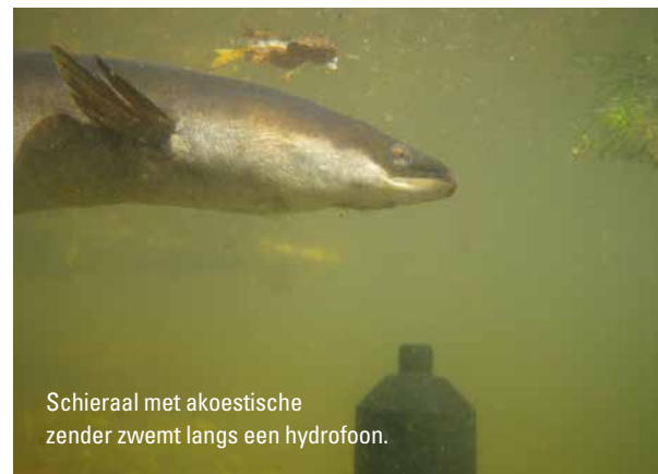
Schieraal met akoestische zender zwemt langs een hydrofoon.

zijn de hydrofoons meestal opgesteld voor en achter boezemgemalen en sluizen op de overgang tussen boezem en het Noordzeekanaal, of een zijkanaal daarvan. Groepen van meestal 25 lokaal gevangen en gezenderde schieralen zijn dan aan de boezemzijde uitgezet, omringd door hydrofoons, waarna het uittrekgedrag en succes van de