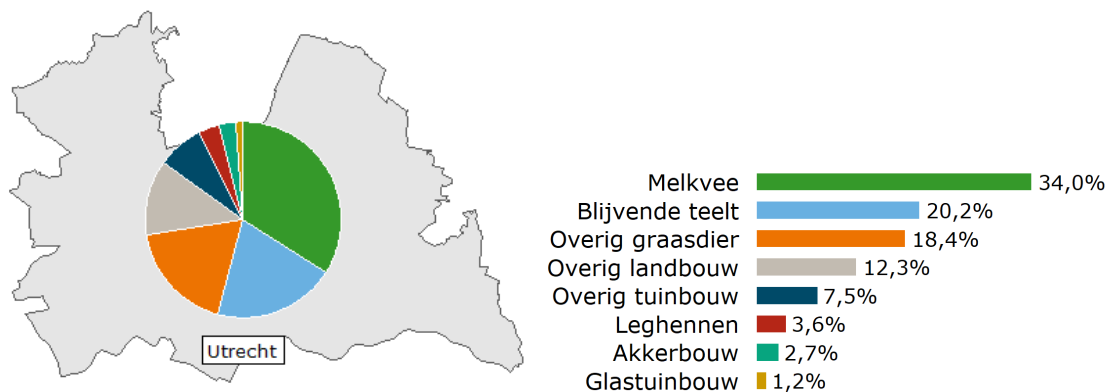
Figuur 1 Verdeling van agrarische bedrijven met afzet via korte keten over de COROP-regio Utrecht, a), b) per regio ingedeeld naar bedrijfstype, 2020

a) %: aandeel bedrijfstype in totaal aantal korteketenbedrijven in Utrecht; b) De omvang van de cirkel heeft een directe relatie met het aantal korteketenbedrijven