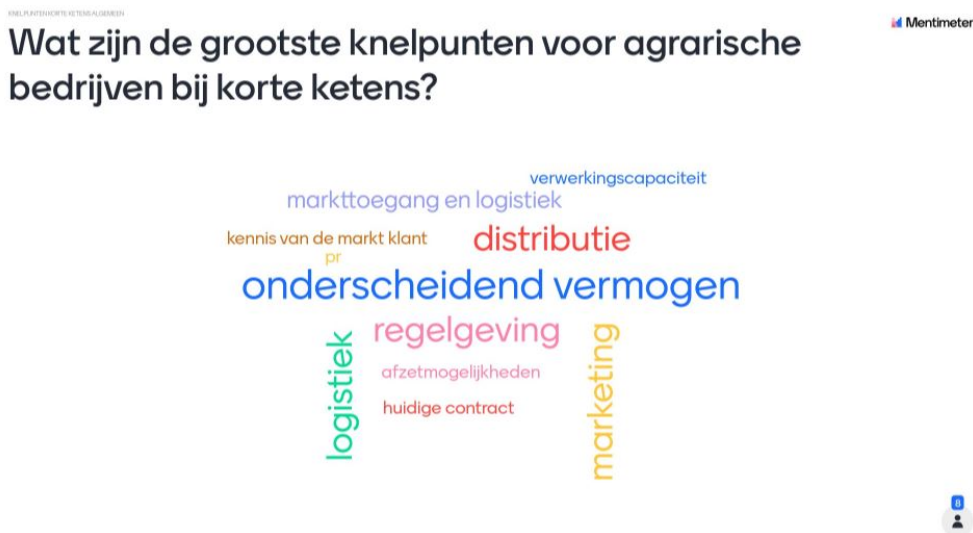
Figuur 4 Genoemde knelpunten rond korte ketens op basis van een sessie met regionale gesprekspartners in Utrecht

Onderscheidend vermogen is in deze sessie een veel benoemd knelpunt in de korte keten (figuur 4). Hoe ga je als ondernemer zorgen dat jouw product uit het schap wordt gepakt en wat doe je als ondernemer nu anders dan de rest? Aanwezigen gaven aan dat de ondernemer een bepaalde volhardendheid moet hebben om het korteketensegment van het bedrijf tot een succes te brengen. Dit gaat verder dan communicatie: men moet in staat zijn om de klant te bewegen om zijn producten te kopen. En dit moet uiteindelijk gebeuren in een markt die hypercompetitief is.