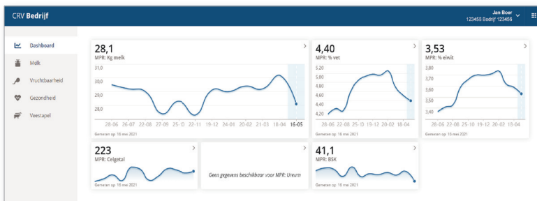
In CRV Bedrijf kunnen gebruikers overzichten maken, bijvoorbeeld van de mpr