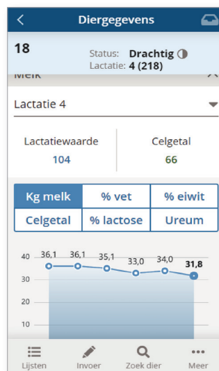
In CRV Dier kunnen alle diergegevens worden opgevraagd