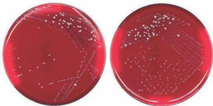
Figuur 1. Op deze twee plaatjes ziet u het verschil tussen handmatig uitstrijken (links) en uitstrijken via de WASP (rechts). Op het rechterplaatje ziet u een duidelijk patroon met beter onderscheid en meer losliggende kolonies. Met de hand eindigt veel materiaal aan de rand van de plaat en dat kun je niet gebruiken.

Het selecteren en etiketteren van monsters, het open- en dichtdraaien van buisjes, het pipetteren, uniform enten en spatelen van platen en het sorteren en automatisch registreren in LIMS (het Laboratorium Informatie Management Systeem) wordt nu ►