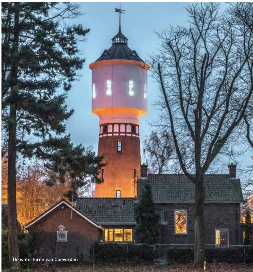
De watertoren van Coevorden

in rap tempo buiten werking gesteld. Hoeveel er nog in functie zijn, kan Van der Veen niet met zekerheid zeggen. Volgens de database op de NWS-website, waarin de stichting de status van elke toren nauwgezet bijhoudt, zijn het er 41. "Maar soms horen we dat een toren al buiten gebruik is, terwijl wij dachten dat hij nog functioneerde. Het is nogal dynamisch."