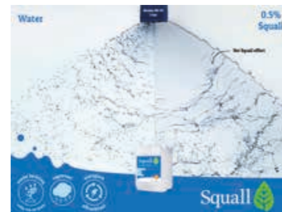
Het Squall effect zichtbaar voor een Airmix 11003 dop. De spuitkegel wordt stabielier waardoor kleine driftgevoelige druppels moeilijker kunnen ontstaan.

Het wordt mogelijk om middelen die volgens etiket moeten voldoen aan 90% driftreductie te verspuiten met een 75% dop aangevuld met Squall. Daarmee wordt de keuze voor doppen groter en komt ook de keuze voor fijne druppels terug. Inmiddels is er door Squall op meerdere gebieden onderzoek gedaan. Sijs haalt de onderzoeksresultaten naar voren waarbij middelen met 95% driftreductie eis gespoten kunnen worden met een 90% dop en Squall. Hierbij is het bedekkingsresultaat beter is