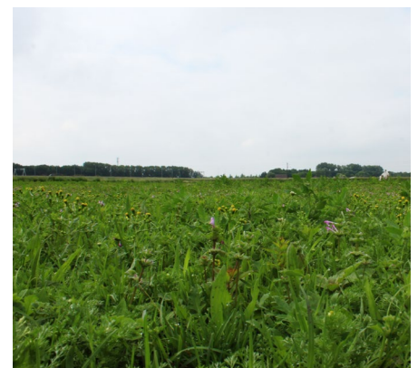
Voorbeelden van kruidenrijk grasland