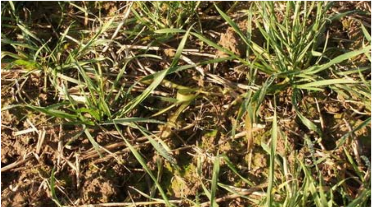
Figuur 1. Het 'gewas' soedangras temidden van tarwe-opslag, 9 november 2004.