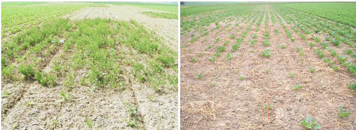
Figuur 2, links. Slecht afgestorven koolzaad, na opkomst van de suikerbieten, 2 juni 2005.