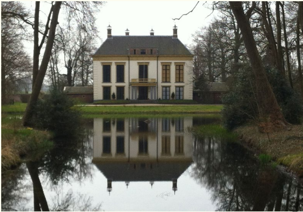
Landhuis met vijver april 2013.

decoreerde middenpartij en een architectuur geleed met blindnissen. Nijenburg en de bijbehorende landerijen zijn sinds het midden van de 16de eeuw eigendom geweest van de familie van Egmond van de Nijenburg en gingen via vererving over naar de familie van Foreest. Jaren van achteruitgang en financiële noodzaak deden de familie aan het begin van de vorige eeuw besluiten delen van het land te gaan verkopen, ook al was de familie er alles aan gelegen om Nijenburg in bezit te houden en ook al rustte op de schouders van de oudste zoon de beklemmende plicht om het landgoed te behoeden voor verkoop of versnippering. Een belangrijke maatregel om verkaveling van het landgoed Nijenburg te voorkomen kwam van Pieter van Foreest (1845 - 1922). Hij nam het initiatief tot de oprichting van de NV maatschappij Nyenburgh tot exploitatie van onroerende goederen te Heiloo' en slaagde erin om het familiebezit grotendeels te sparen.