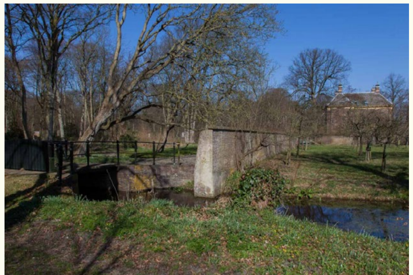
Boomgaard met tuinmuur.

Nijenburg was een groot landgoed met tuinen, bossen en landerijen met boerderijen, gelegen op een strandwal tussen Alkmaar en Hei-