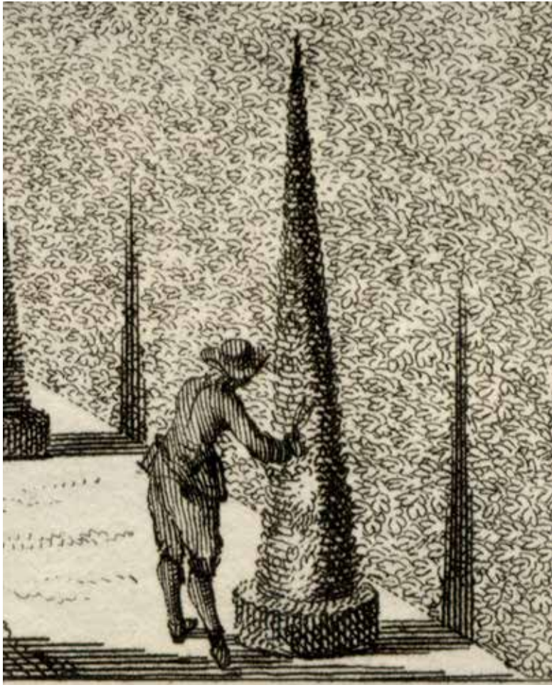
Afbeelding 4. (rechts) Hovenier snoeit een hoge haag met een sikkelmes op een lange stok (Hendrik de Leth, Het Zegepraalant-Kennemerlant, Gezicht door de lindelaen naer het terras in de lustplaats Velzerhooft, 1729)