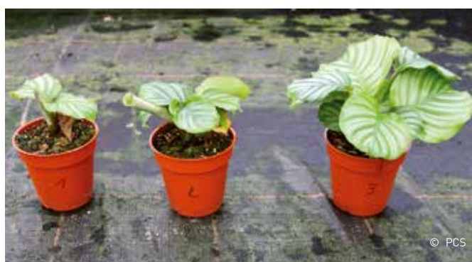
De jongplanten opgekweekt in de meerlagenteelt (1 & 2) bleven duidelijk kleiner dan de jongplanten opgekweekt in de serre (3).