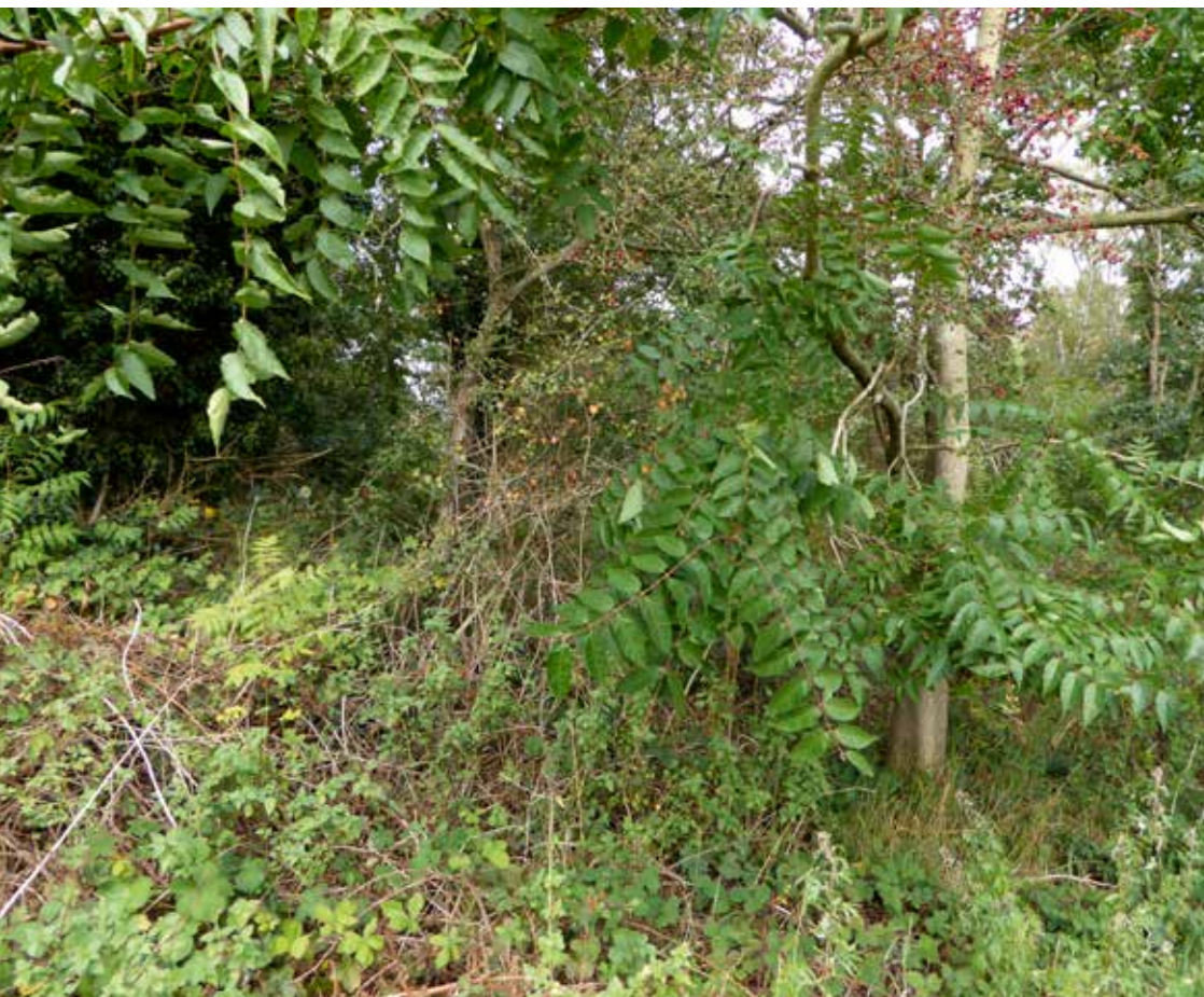
Foto 5: Hemelboom met uitzaaiingen: een zeer invasieve boomsoort in een Natura 2000 bos.

Plantmateriaal Bomen ingesteld om voorstellen te doen voor uitwerking van de motie.