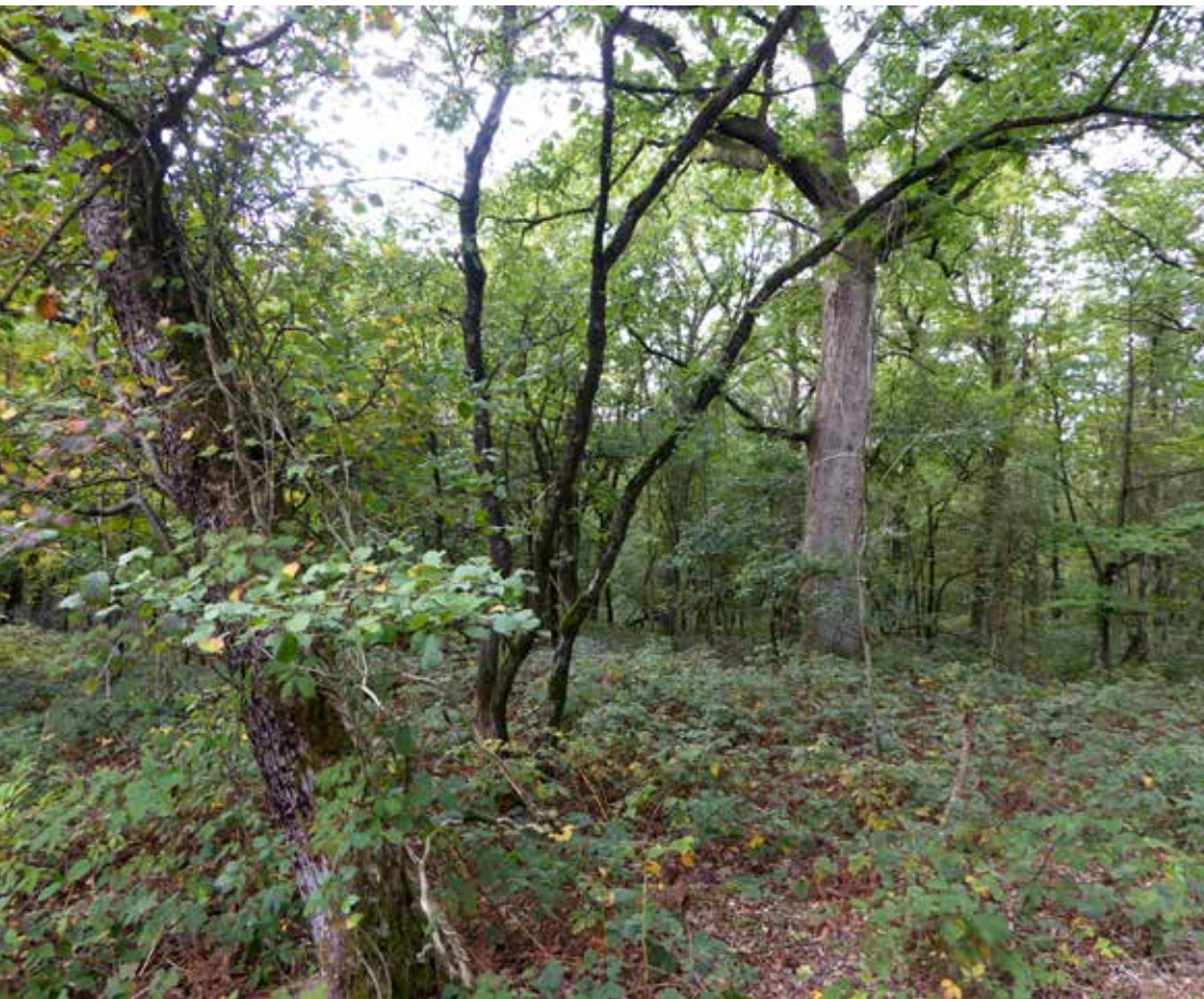
Foto 4: Zeldzame wilde appel in de Zelderse Driessen, Natura 2000 bos in Noord-Limburg.