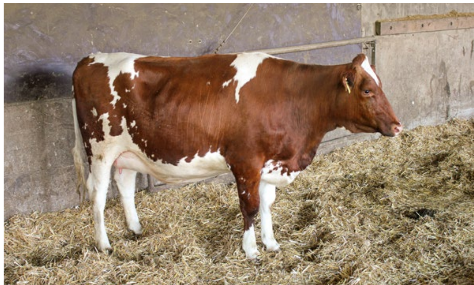
De uitdrukking en houding van deze hoogdrachtige vaars zijn gespannen. De zijwaarts gerichte oren en huidplooiën op de kaak maken haar verdacht. Ze laat nog niet zien wat er aan de hand kan zijn, maar dat verandert al snel.

Waarnemen, begrijpen wat je ziet, eigen maken en weer opnieuw toepassen met bewust gebruik van je kennis, kan verbazingwekkende resultaten respectievelijk antwoorden opleveren. Zoals in het voorbeeld op de drie foto's. Deze vaars, die tegen afkalven aan zit, heeft na een minuut waarnemen duidelijk gemaakt wat het probleem is. In eerste opzicht leek ze gewoon een onopvallende koe. §