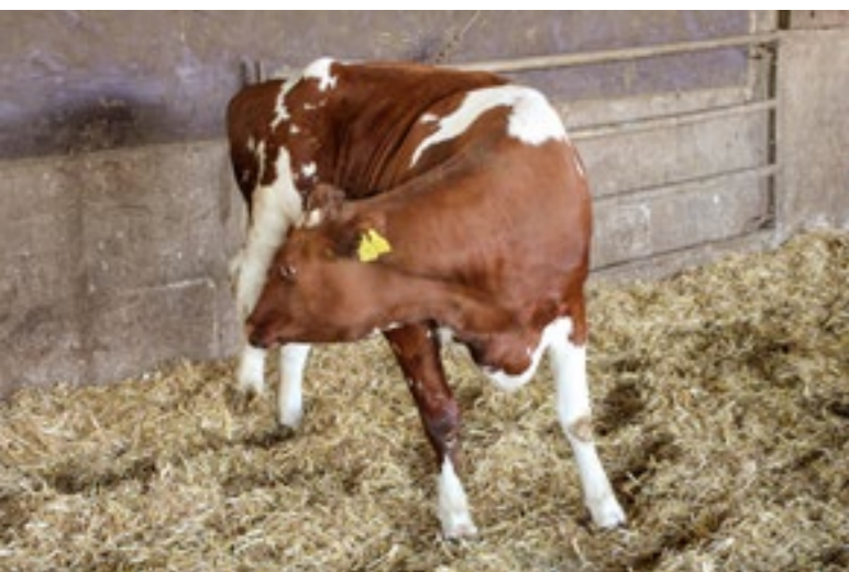
Nadat ze de waarnemer ongevaarlijk acht, wendt ze zich weer tot hetgeen haar pijn doet.