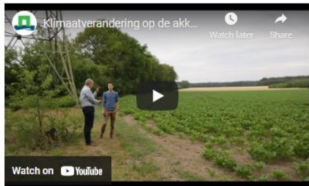
Klimaatverandering op de akker

Door deze veranderingen en daaraan gerelateerde financiële risico's voor boerenbedrijven in kaart te brengen, wordt duidelijk waar de knelpunten gaan ontstaan en waar adaptatiemaatregelen toegepast kunnen worden om deze risico's beheersbaar te houden.