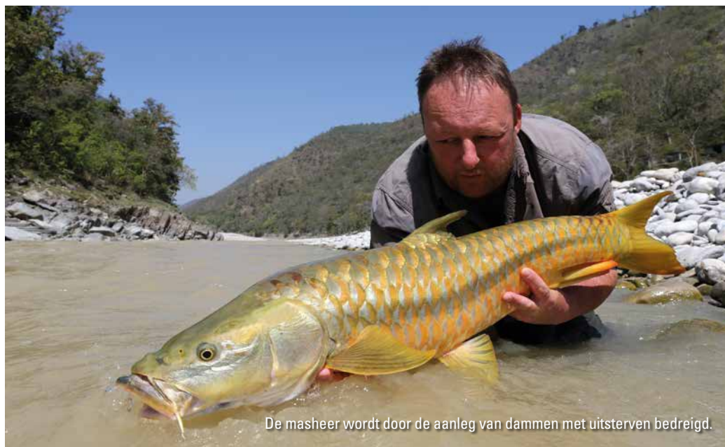
De masheer wordt door de aanleg van dammen met uitsterven bedreigd.