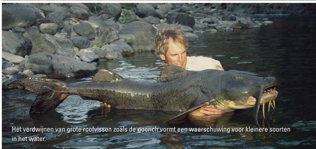
Het verdwijnen van grote roofvissen zoals de goonch vormt een waarschuwing voor kleinere soorten in het water.

beken in Oost-Brabant in 2019 en 2020 toont op klein zakformaat een trend die we elders vaker gaan zien. Bierkens: “Veel mensen snappen nog niet goed dat grondwater in contact staat met het oppervlaktewater en dat het oppompen van grondwater dus kan leiden tot minder waterafvoer door rivieren – en daarmee ook tot een daling van het waterniveau. Dat heeft op zijn beurt natuurlijk weer effecten op aquatische ecosystemen. Dat kan een belangrijke factor worden als oppervlaktewater schaarser wordt en landbouwgewassen meer water vragen door hogere temperaturen.” Velen zien rivieren als een goot voor afstromend smelt- en regenwater, maar dat is volgens Bierkens maar een deel van het verhaal. “Het verschilt per stroomgebied, maar gemiddeld komt dertig á vijftig procent van de rivierafvoer