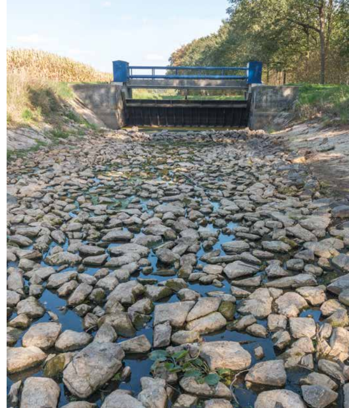
Lage waterstanden zorgt voor een verhoging van de watertemperatuur van het overgebleven water.

Beleidsmakers en financiers snappen volgens De Roos inmiddels dat waterkracht geen groene energie oplevert. De dramatische ecologische schade en fragmentatie door dammen en stuwen staan in geen verhouding tot de stroomopbrengst. “Binnen de Europese