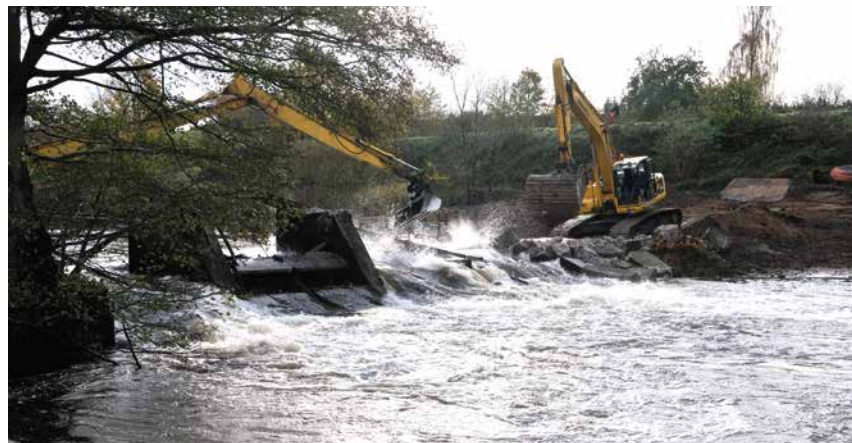
Het verwijderen van dammen geeft hoop voor vis.

Commissie en bij investeringsbanken worden dan ook steeds meer vraagtekens gesteld bij de bouw van nieuwe dammen. Er is zelfs een Europees beleidsdoel voor herstel van 25.000 kilometer vrij stromende rivieren tot 2030.” Ook het verwijderen van oude dammen in Europa komt volgens De Roos op gang. “Je ziet dat trekvissen hun weg in no time weer vinden als ze hun neus niet meer stoten. Als natuurlijke processen zich herstellen en er nog kleine populaties aanwezig zijn, kunnen aantallen dus snel gaan groeien. Dat is een hoopvolle gedachte.” ■