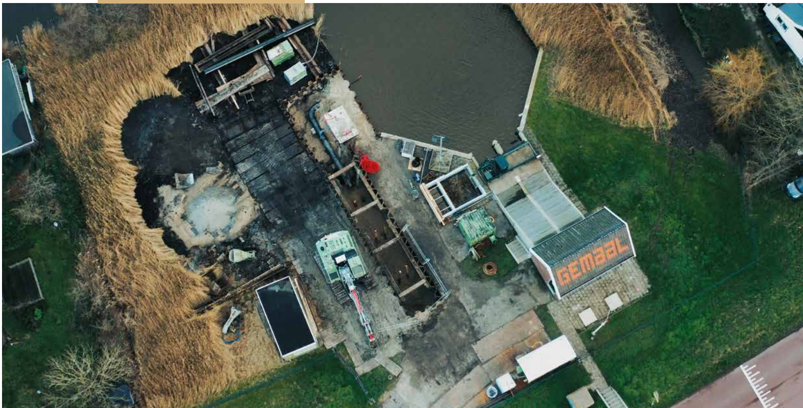
De vispassage Nauerna verbindt het Noordzeekanaal met de polder van Assendelft.

onze jaartelling vormde het Oer IJ, dat tussen Velsen en Castricum gedurende vele millennia in zee uitstroomde, een rechtstreekse verbinding voor vis tussen de zee en het stroomgebied van de Rijn. De routes die trekvisen volgen van en naar het Noordzeekanaal en ommelanden sluiten dan ook aan op natuurlijke routes die deze populaties eeuwenlang hebben gevolgd.