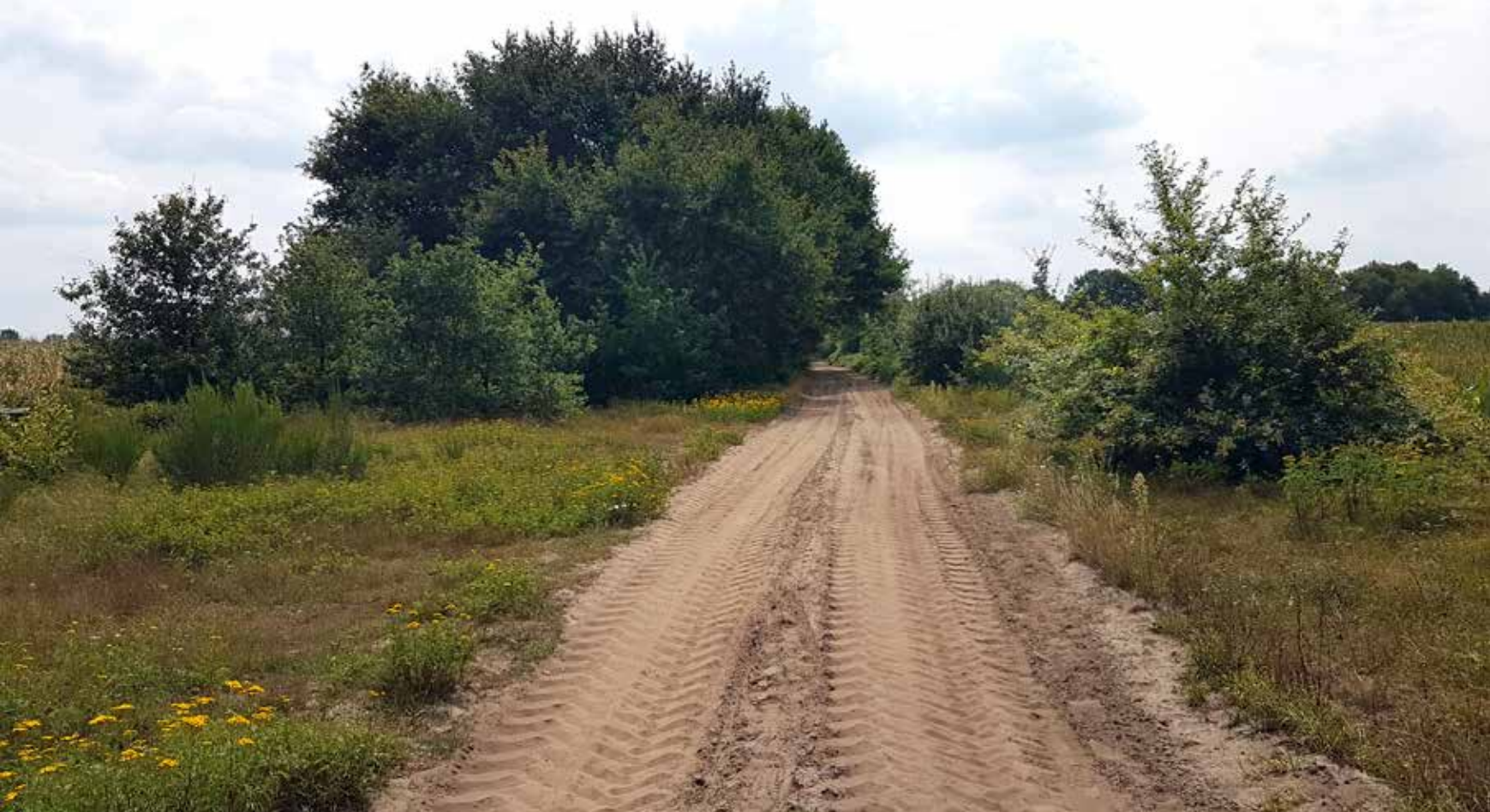
Figuur 3: Met 53 soorten, waaronder diverse minder algemene, een van de meest waardevolle zandwegen uit het onderzoek, aan weerszijden geflankeerd door maïs (Heesch).

zandwegen was bij alle onderzochte soortgroepen terug te zien (zie figuur 5), maar de verschillen waren het grootst binnen de soortenrijkere groepen. Wanneer we in de beoordeling van de proefvlakken de 'bijzonderheid' van de aanwezige soorten meewegen door soorten te voorzien van een score van 1 tot 8, afhankelijk van mate van landelijk vastgestelde zeldzaamheid, Rode lijststatus en provinciale prioritaire status, dan blijken de asfaltwegproefvlakken een significant lager scorende en dus triviale fauna te herbergen dan de zandwegproefvlakken. Dit geldt zowel gemiddeld per proefvlak als cumulatief voor alle proefvlakken samen. De verzamelde gegevens impliceren dat wanneer een zandweg in de onderzochte regio wordt geasfalteerd, verwacht mag worden dat de bijzonderheid van de soortensamenstelling ter plaatse gemiddeld 36 procent achteruit gaat, uitgaande van de soortgroepen die in dit onderzoek zijn meegenomen en de gebruikte wegingsmethode.