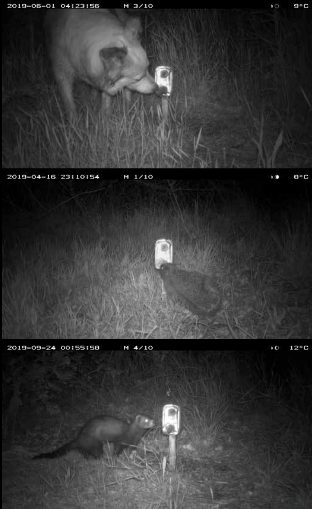
Figuur 3 Enkele voorbeelden van resultaten behaald met de Sardientjesmethode. Alle beelden zijn gemaakt in een tuin in Oost-Nederland. Opeenvolgend hond, egel, bunzing, huiskat, haas en steenmarter.