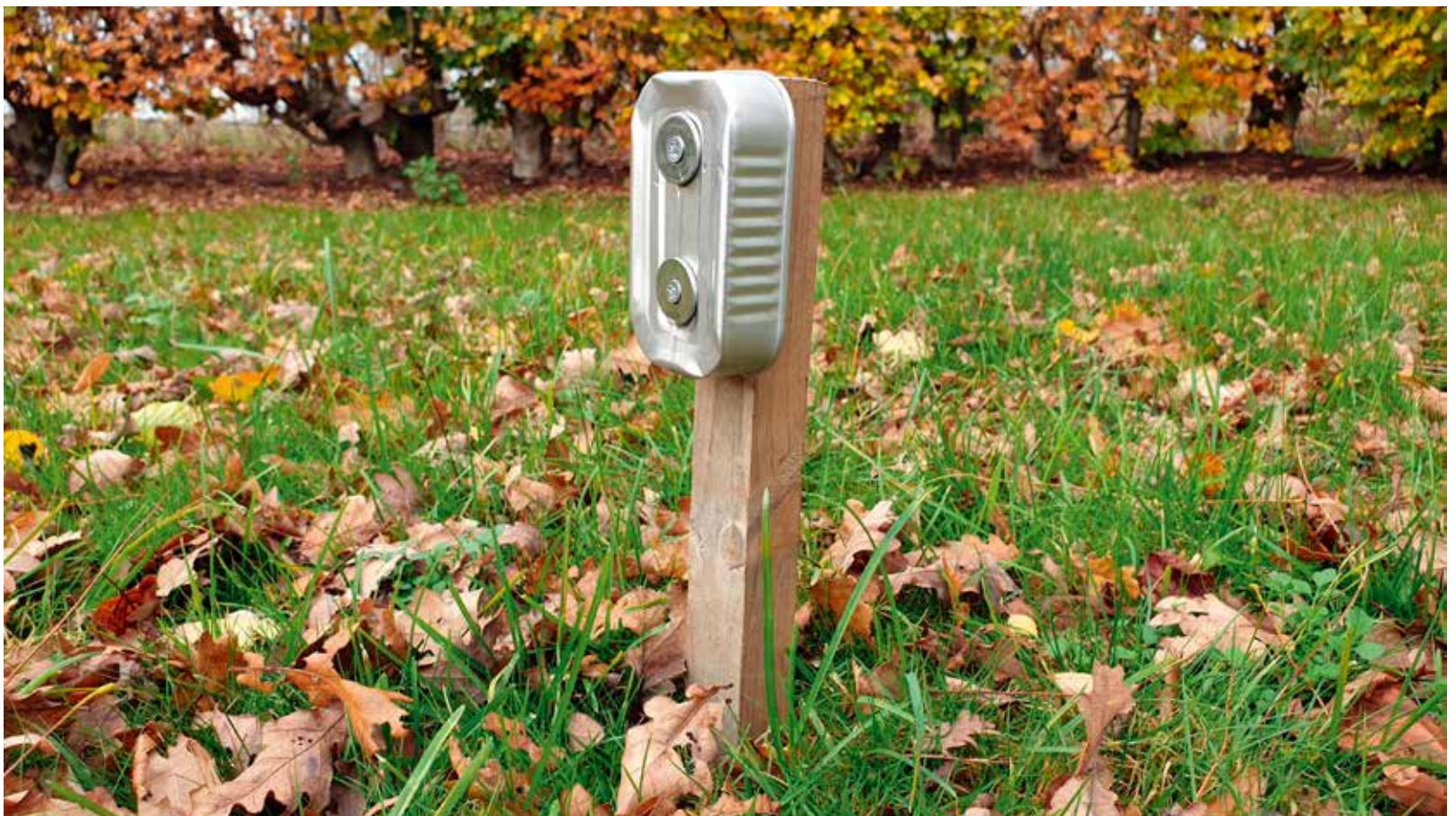
↓ Figuur 2. Het geurstation van de Sardientjesmethode bestaat uit een blikje sardines wat door het blikje heen wordt vastgeschroefd aan een houten paaltje. Het gebruik van O-ringen onder schroefkop voorkomt dat dieren zoals honden of vossen om het blikje van het paaltje trekken.