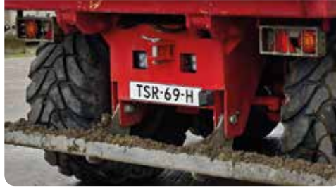
Niet geregistreerde getrokken voertuigen voeren een witte volgplaat. Tot 1 januari 2025 hoeft er nog geen witte volgplaat op, als de kentekenplaat van het trekkende voertuig van achteren zichtbaar is.