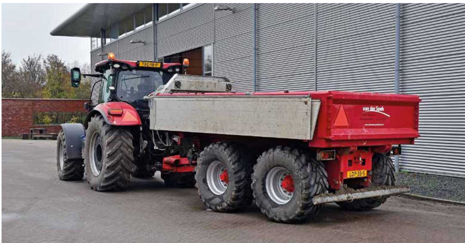
Vanaf 2021 moeten alle (land)bouwvoertuigen die op de openbare weg rijden geregistreerd worden en wanneer ze harder rijden dan 25 km/u een kentekenplaat gaan voeren.

Vanaf 1 januari 2021 worden (land)bouwvoertuigen op de openbare weg registratieplichtig en gaat de maximumsnelheid omhoog van 25 naar 40 km/u. Alle voertuigen die sneller rijden dan 25 km/u moeten dan ook direct een gele kentekenplaat voeren. Ons advies: registreer al je bestaande (land)bouwvoertuigen in 2021, want dat bespaart tijd en geld.