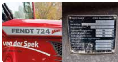
Op de constructieplaat staat meestal het type vermeld. Dit kan hetzelfde zijn als de handelsbenaming op de buitenkant van het voertuig, maar dat hoeft niet.

Het voertuigidentificatienummer (VIN) maakt elk voertuig uniek identificeerbaar. Bij veel getrokken materieel ontbreekt echter een ingeslagen VIN, maar zit er wel een constructieplaat op met het fabrieks- of constructienummer. Op eigenbouw-voertuigen ontbreekt meestal ook een VIN of constructienummer. Belangrijk is dat er op het voertuig een uniek identificatienummer aanwezig is. Voor registratie volstaat een constructieplaat met een uniek nummer. Zo niet, dan kan het voertuig niet worden geregistreerd.