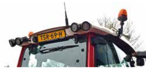
In 2021 moeten (land)bouwvoertuigen die harder rijden dan 25 km/u direct een gele kentekenplaat voeren.