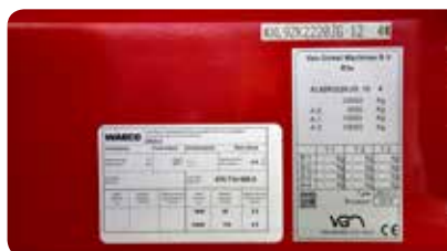
Voor registratie volstaat een constructieplaat met een uniek nummer of ingeslagen VIN. Zo niet, dan kan het voertuig niet worden geregistreerd.