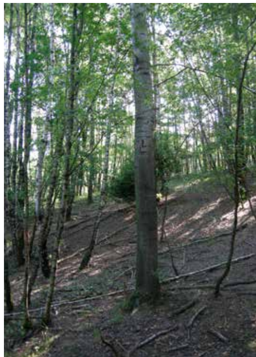
Boven: wortelloten ratelpopulier in de wegberm van de Deelenseweg Links: dikke ratelpopulier in Stikke Trui, Veluwezoom Onder: boorspaan ratelpopulier met links de kern