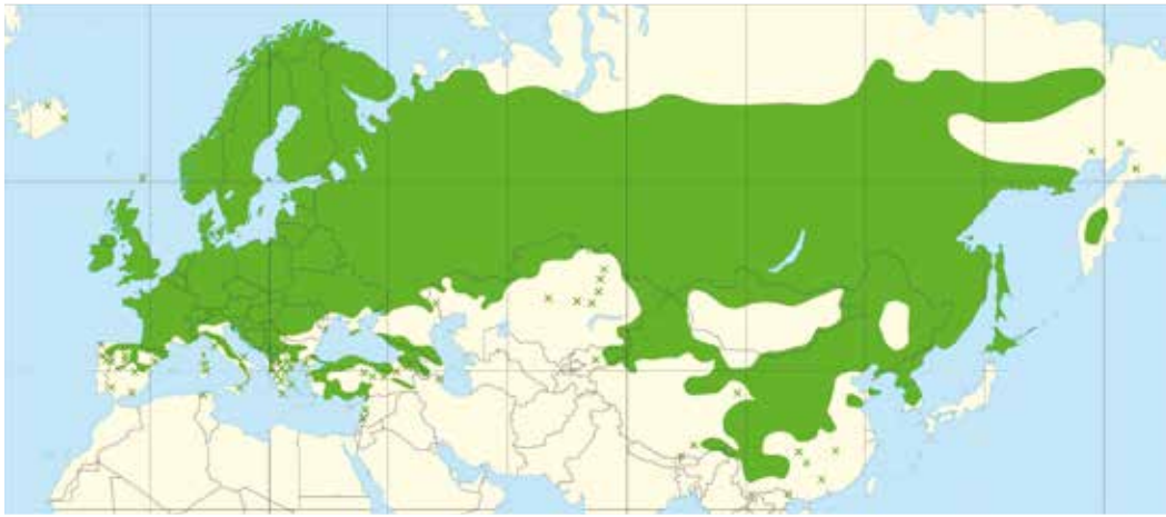
Boven: verspreidingsgebied Populus tremula in Europa en Azië Onder: verspreiding in Nederland