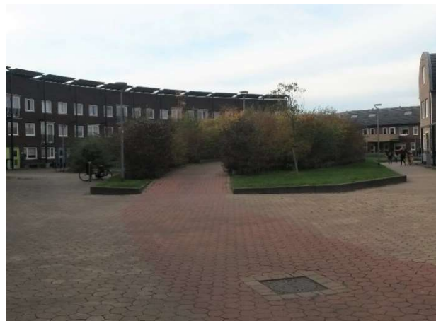
Figuur. Links: Den Haag, voorbeeld van een speelruimte geschikt voor balspellen en met weinig beschikbaar groen. Rechts: Almere, een voorbeeld van een speelruimte met horizontaal reliëf.