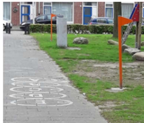
Figuur: elementen van de speelroute in Tilburg