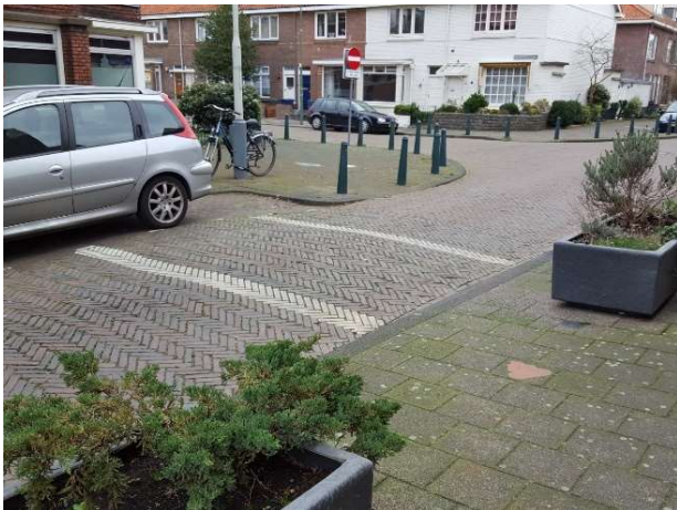
Oversteekplek in Den Haag op zichzelf staand verkeerselement deels geblokkeerd door geparkeerde auto

Bekendheid van speelroutes is een ander belangrijk issue, veel ouders zijn er niet mee bekend en de route moet onderhouden worden. Zowel fysiek: onderhoud, nog up-to-date als qua communicatie omdat er steeds een nieuwe groep kinderen van de route gebruik maakt terwijl de vorige gebruikers de route ontgroeid zijn.