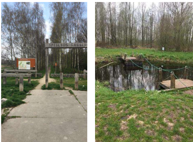
Figuur Ingang en speelelementen van het Gagelbos.

Concluderend leek het Gagelbos voor ouders en kinderen geen significant beter aanbod bleek te hebben dan de groene ruimtes in de wijken. Om de aandacht te trekken en het gebruik te verhogen moet het Gagelbos een uitzonderlijke gelegenheid bieden voor natuurervaringen en goed geadverteerd worden.