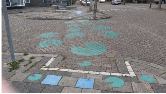
Figuur. Links: voorbeeld van gekleurde tegels. Den Haag. Rechts: Leeuwarden, voorbeeld patronen op speelroutes