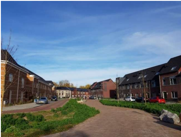
Route in Deventer geïntegreerd in de inrichting van de wijk