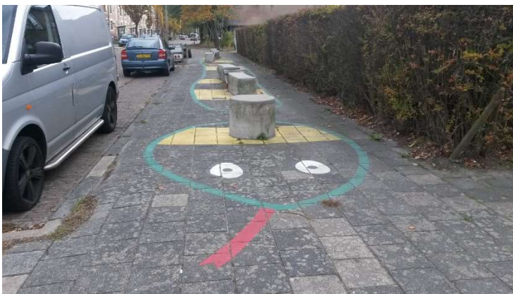
Foto van Leeuwarden spelelementen als onderdeel van de route

Veiligheid is een belangrijk issue voor ouders, met name verkeerveiligheid. In speelroutes is hier aandacht voor, met name in de vorm van oversteekplaatsen en dit wordt door ouders ook gezien. Voor een deel van de kinderen geldt dat zij ook eerder zelfstandig over straat mogen en onder andere omdat speelroutes het veilig oversteken ondersteunen. Er is in dit onderzoek echter geen relatie aangetoond tussen speelroutes en meer buitenspel. Daarnaast maken ouders zich vaak zorgen over verkeerveiligheid en gebrek aan handhaving zoals het negeren van zebra's en het zich niet houden aan snelheidsbeperkingen door automobilisten. Zulke problemen zijn groter dan de oplossingen die de speelroute kan bieden en hiermee ook niet op te lossen maar hebben wel weerslag op het gebruik ervan. Aanbevolen wordt om verkeersissues in de totale omgeving aan te pakken en speelroutes goed te integreren in de omgeving. Bijvoorbeeld in plaats van een oversteekplek creëren op een stuk waar te hard wordt gereden kan de inrichting van de ruimte zo zijn dat te hard rijden lastiger wordt en/ of dat de indeling zo wordt dat dit stuk vermeden kan worden.