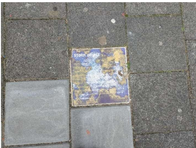
Deels beschadigde spelelementen in Den Haag

Bekendheid van speelroutes is een ander belangrijk issue, veel ouders zijn er niet mee bekend en de route moet onderhouden worden. Zowel fysiek: onderhoud, nog up-to-date als qua communicatie omdat er steeds een nieuwe groep kinderen van de route gebruik maakt terwijl de vorige gebruikers de route ontgroeid zijn.