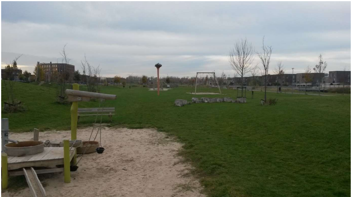
Figuur. Foto uit Almere met een speelgebied waarin fysieke en natuurlijke elementen voorkomen

Deze inzichten naar de belangrijke kenmerken van de fysieke omgeving zijn van belang omdat een stimulerende omgeving die meerdere vormen van buitenspel stimuleert kinderen kansen biedt zich te ontwikkelen tot hun volle potentieel. Verdere onderzoeken zouden dieper op deze kenmerken in moeten gaan om te bestuderen hoe ze toe te passen zijn in de praktijk. Er moet echter rekening gehouden worden met het gegeven dat buitenspel een zeer breed concept is en de huidige onderzoeken sterk verschillen in welke uitkomsten ze meten. Er is een holistische benadering van buitenspel nodig, vooral als de bevindingen bedoeld zijn voor toepassing in de praktijk.