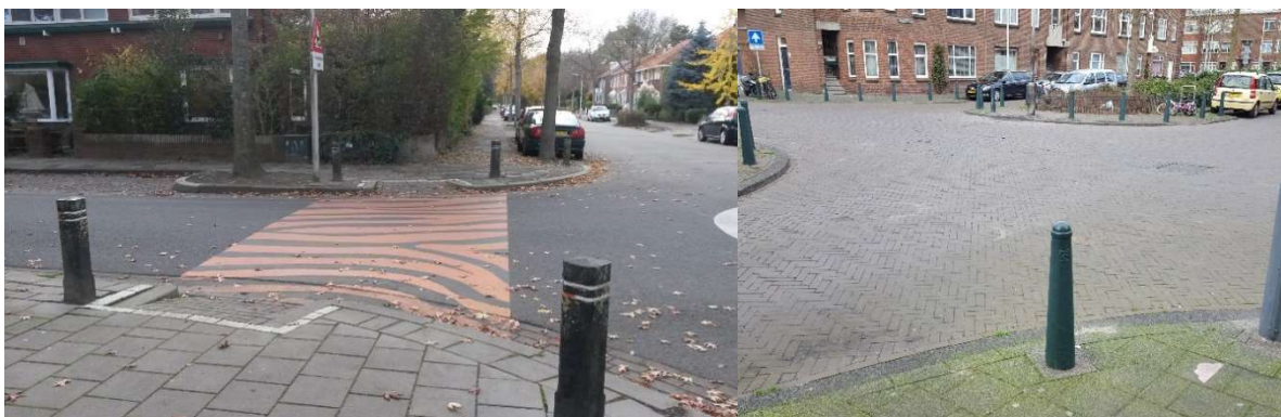
Figuur. Links: Leeuwarden, voorbeeld van een duidelijk aangegeven oversteekpunt. Rechts: Den Haag voorbeeld van een oversteek punt zonder aanduidingen

Routes moeten onderhouden en up-to-date blijven, hieronder vallen reparaties, schoonhouden en vernieuwen maar ook het blijvend ondersteunen van bekendheid (publiciteit).