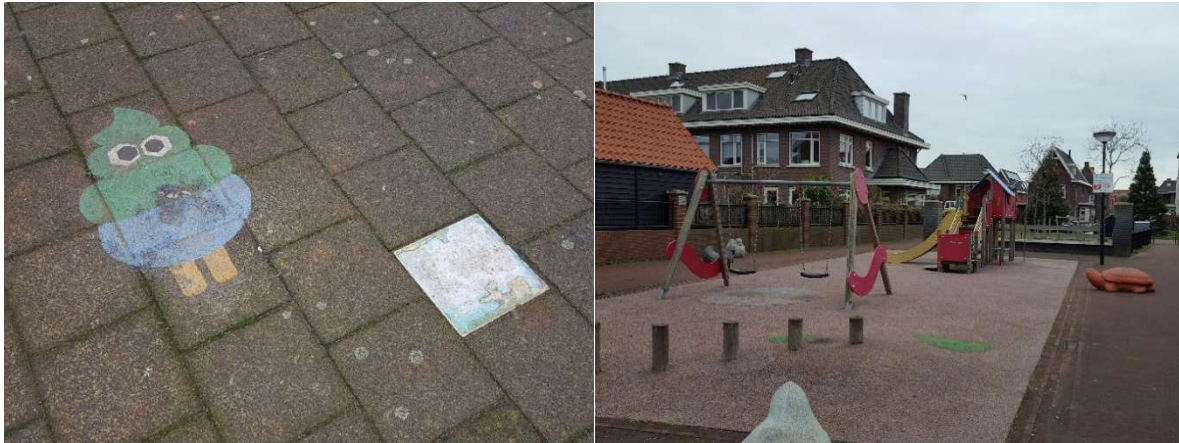
Figuur. Foto's uit Den Haag, voorbeeld van veroudering en een speeltuin voor een jonge doelgroep op speelroutes