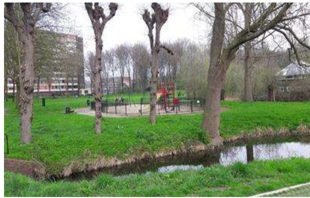
Figuur: Groen- en speelelementen in Utrecht Overvecht