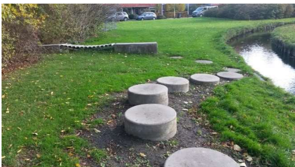
Speelelementen in Leeuwarden met variatie en uitdaging

Het is lastig aan te tonen in hoeverre speelroutes bijdragen aan meer buitenspelen door kinderen. Om dit te onderzoeken zou een voor- en nameting nodig zijn bij invoer van een speelroute, iets wat binnen de loop van het onderzoek niet mogelijk was. Interviews met ouders en kinderen laten zien dat speelroutes lijken bij te dragen aan speelplezier maar dat kinderen niet specifiek om de speelroute naar buiten gaan. Wel is er een behoefte bij ouders en kinderen aan meer plek om te spelen. Op plaatsen waar weinig fysieke ruimte is kunnen speelelementen op een bestaande stoep de ervaren speelruimte vergroten.