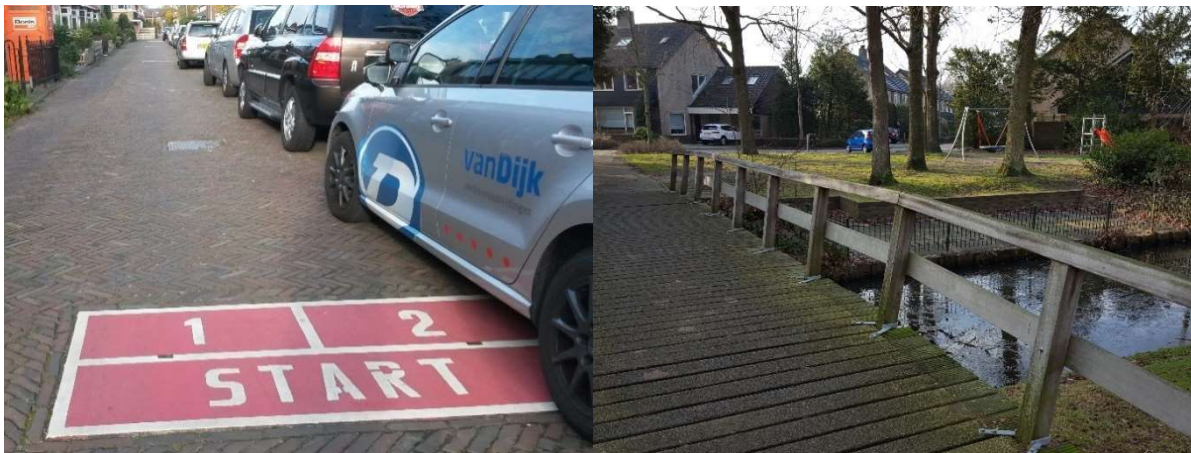
Figuur. Links een voorbeeld van verkeer op een speel element in Leeuwarden. Rechts een voorbeeld van speelroute dichtbij het water in Eemnes.

Over het algemeen waren kinderen en ouders het met elkaar eens. Ouders zien wat kinderen nodig hebben en leuk vinden, wel zijn ze wat kritischer; kinderen zijn positiever.