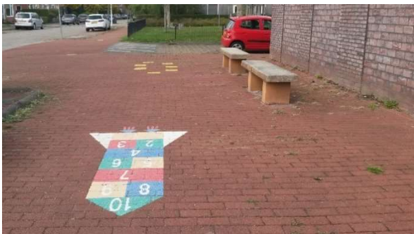
Speelroute in Leeuwarden, kleurrijk en kindvriendelijke

Dit onderzoek geeft inzicht in aspecten van de fysieke omgeving die het spelen van kinderen stimuleren. De belangrijkste kenmerken van een stimulerende speelomgeving zijn: fysieke elementen, natuurlijke elementen, risico en uitdaging, grootte en variatie en diversiteit. Ook is er een tool ontwikkeld waarmee deze elementen in beeld gebracht kunnen worden bij speelroutes. Elementen in de tool zijn: Locatie en toegankelijkheid, Gezondheid en veiligheid, Speel-, beweeg- en recreatiewaarde, Verkeer, Groen en natuur, Sociale kansen Deze tool en achtergronden kunnen dienen voor om speelroutes beter te laten aansluiten op de behoeften van kinderen. Ook kunnen kinderen meer betrokken worden bij de ontwikkeling van speelroutes, dit gebeurt al wel maar is niet de standaard. Met deze tool zijn 6 speelroutes geobserveerd waaruit bleek dat de onderzochte speelroutes goed scoren op kleurrijk, kindvriendelijk, vrolijk, veilig, verrassende elementen en dat verbetering mogelijk is op variatie en uitdaging. Verschillende speelelementen spreken verschillende groepen aan. Het is daarom belangrijk een keuze te maken voor een bepaalde of juist een combinatie van leeftijdsgroep(en) en de elementen hierop aan laten sluiten.