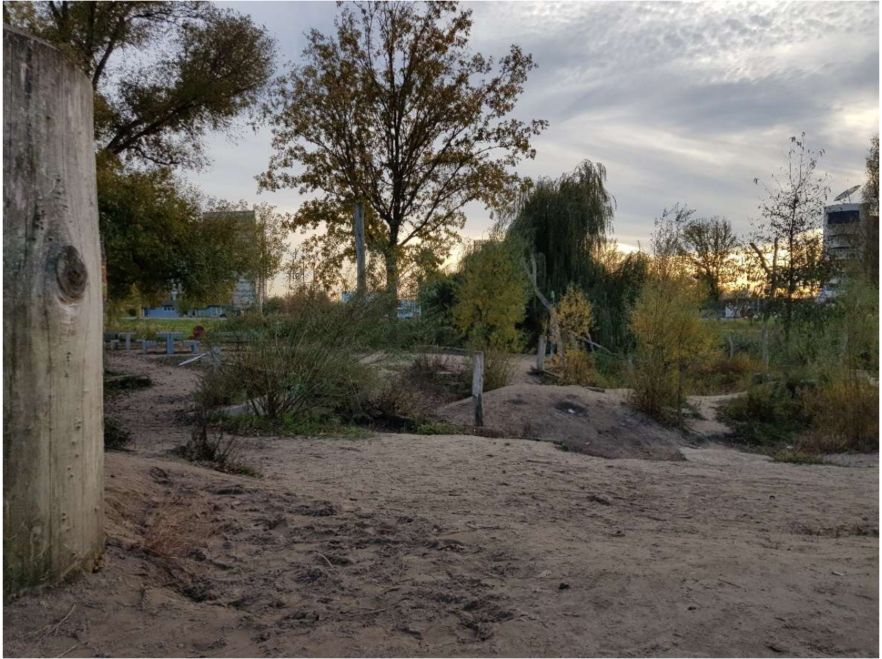
Figuur. Buitenspeelplaats Deventer waar kinderen met natuurelementen in contact komen