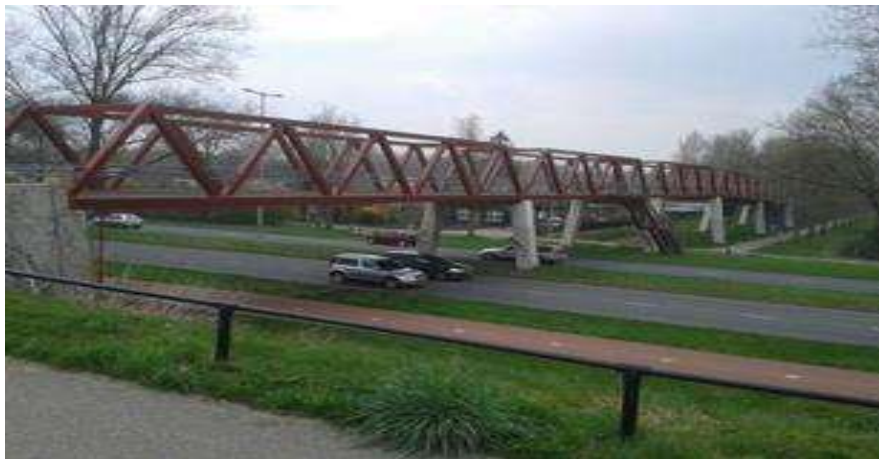
Figuur. Loopbrug tussen de wijk Utrecht Overvecht en het Gagelbos

De blootstelling van kinderen aan groene ruimtes is belangrijk, omdat het hun algehele gezondheidstoestand en hun lichamelijke activiteit verbetert. In sommige buurten echter, spelen kinderen minder buiten en zijn er ook hogere percentages van overgewicht. Utrecht Overvecht is zo'n buurt. In de omgeving van Utrecht Overvecht bevindt zich het Gagelbos, een groene ruimte beheerd door Staatsbosbeheer dat potentie heeft om zowel fysieke activiteit als de verbinding met de natuur te verhogen. De perceptie van Staatsbosbeheer is echter dat deze potentie van Gagelbos nu onderbenut is. Daarom was het doel van deze studie om redenen te identificeren voor de onderbenutting van het Gagelbos door kinderen. Gagelbos en Utrecht Overvecht zijn gescheiden door een drukke weg maar verbonden via een loopbrug.