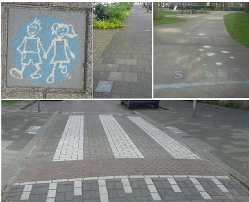
Figuur. Foto's van de elementen van de speelroute in Delft.

Voor het vak 'Settings for Health Promotion' werden vijf masterstudenten door de branchevereniging Spelen en Bewegen gevraagd een eerste stap te zetten in het onderzoek naar de bijdrage van speelroutes op fysieke activiteit van kinderen. Een speelroute is een kindvriendelijke looproute met spelelementen die dient om kinderen tussen 5 en 12 de mogelijkheid te geven om zelfstandig en toch veilig van huis naar school of speeltuin te komen. Een aantal steden in Nederland heeft inmiddels een of meerdere van deze speelroutes aangelegd. Er werd gekozen om de speelroute in Delft te evalueren, omdat hier een van de eerste speelroutes, genaamd het 'Kindlint', ontwikkeld werd na uitgebreid overleg met buurtbewoners, politie en vele anderen. De elementen van de route en het speelgedrag van kinderen op de route werden geobserveerd, daarnaast werden ouders en kinderen geïnterviewd naar hun mening erover.