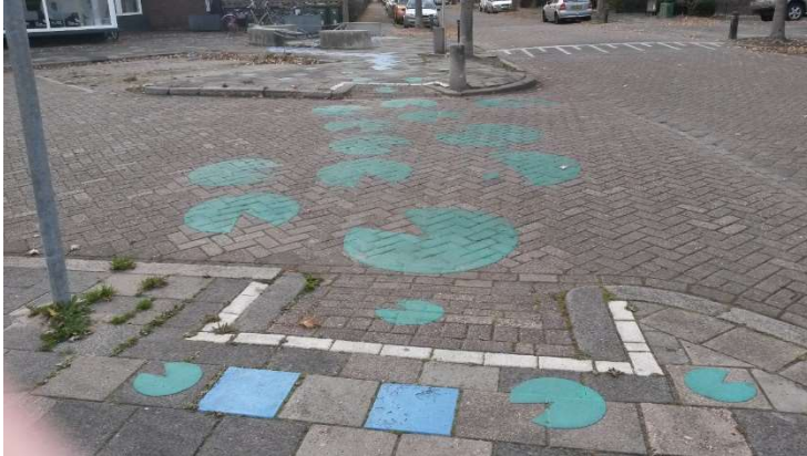
Foto van Leeuwarden speelplek en oversteekelementen worden gecombineerd in een kleine ruimte

Hierbij dient ook de ongestructureerde speelomgeving in beschouwing genomen te worden. Dat is de ruimte die niet ontwikkeld is met ons doel spelen maar wel daarvoor gebruikt kan worden. Deze is voor kinderen minstens net zo belangrijk als de gestructureerde speelomgeving zoals speeltuinen. Op plaatsen waar veel speelruimte is voegt de route minder toe.