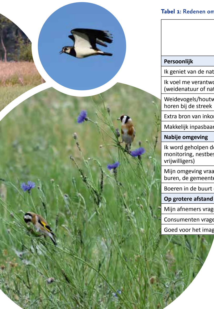
Tabel 1: Redenen om deel te nemen aan ANLb (meerdere antwoorden waren mogelijk)