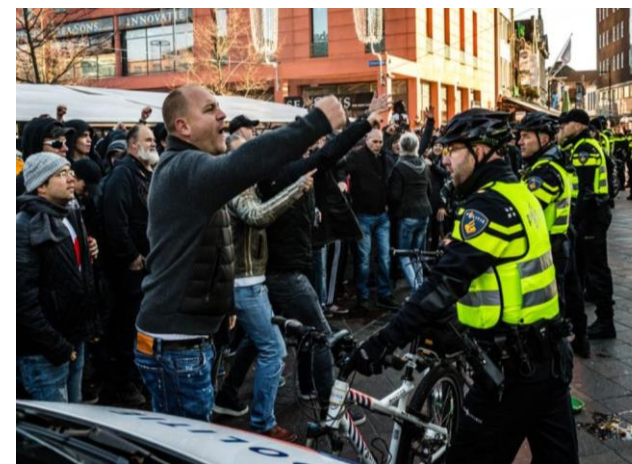
Beeld: Ongeregelde heden bij de intocht van Sinterklaas in Eindhoven in 2018 (Volkskrant, 23 November 2018).

Los van de politiek, zien we ook in de maatschappij dat er angst heerst om te verliezen wat we hebben. De jaarlijks terugkerende verbetering rondom Zwarte Piet is exemplarisch voor een grote groep Nederlanders die zich onzeker, miskend en machteloos voelt. Een zelfbewuste allochtone minderheid eist haar plaats in de samenleving op en vindt Zwarte Piet racistisch. Vervolgens voelt de een ander deel van de samenleving zich bedreigd omdat het Sinterklaasfeest al decennia ingenesteld is in de Nederlandse cultuur. Het verlies van Zwarte Piet is voor deze groep de zoveelste aanval op de nationale identiteit. Vroeger kon er nog onbekommerd Zwarte Piet gespeeld worden, zonder dat iemand erover zeurde.