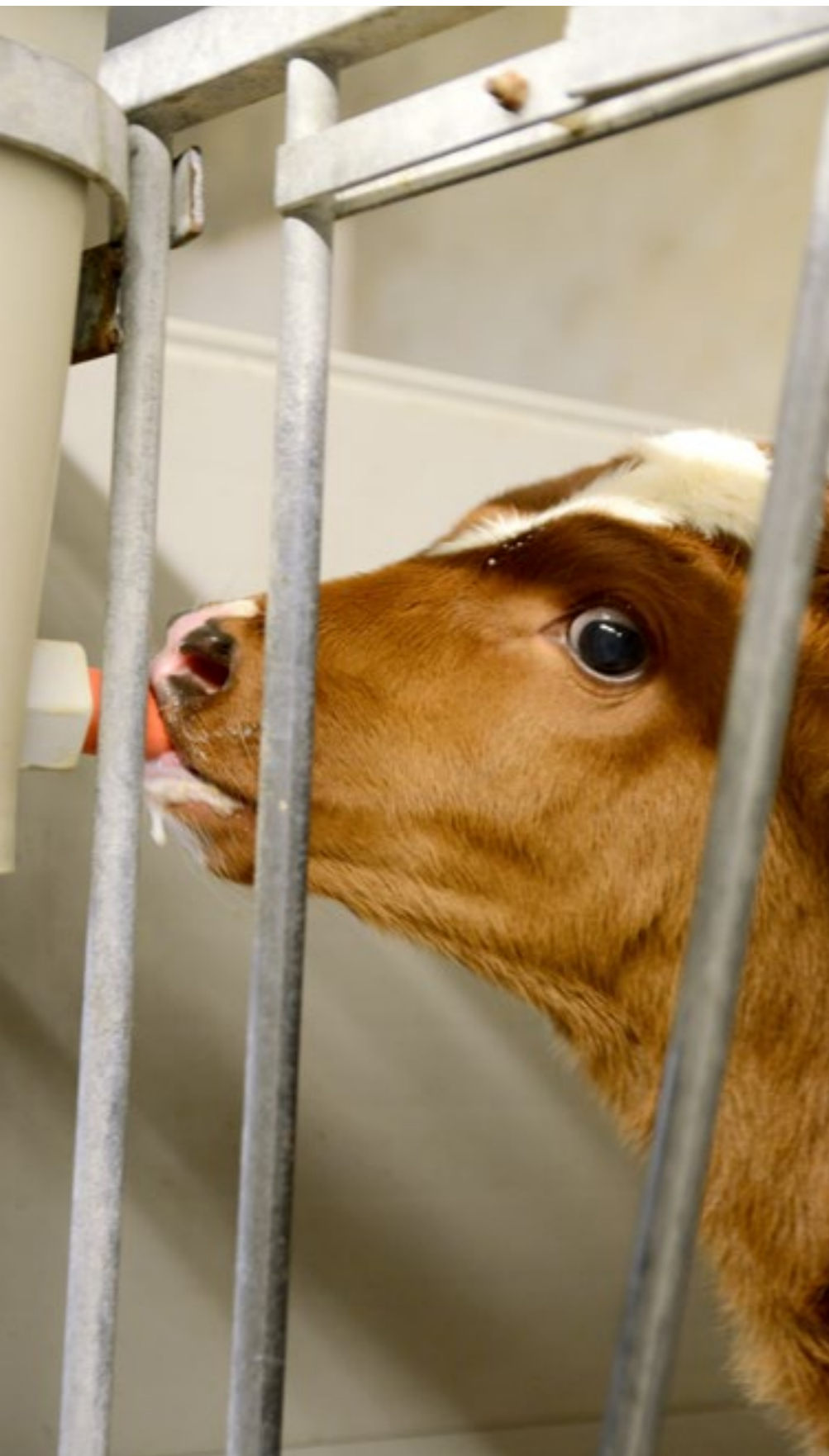
Biest zorgt voor weerstand tegen onder andere pinkengriep op jongere leeftijd.