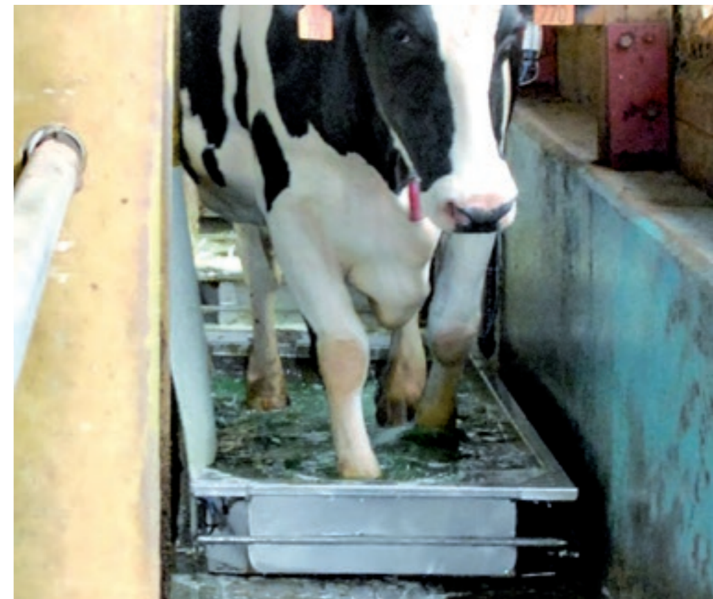
Een klauwbad moet voldoende lang en diep zijn.

Wie kent het niet? Hoestende kalfjes die niet willen vreten en duidelijk benauwd zijn. Ze staan met een pompemde ademhaling of blijven liever liggen wanneer je bij het hok komt. Meestal is pinkengriep de oorzaak, strikt genomen is dat een aandoening van de luchtwegen die wordt veroorzaakt door het RS-virus. Helaas blijft het vaak niet bij een virusinfectie. Er komen bacteriën bij zoals de beruchte Mannheimia en dat is ook de reden dat de kalveren behandeld moeten worden met antibiotica. Daarnaast hebben ontstekingsremmers ook een gunstig effect op het herstel. Een behandeling van drie dagen is meestal voldoende om het kalf weer gezond te krijgen. Wanneer moet je behandelen? Als een kalf hoest en koorts heeft moet je direct ingrij-