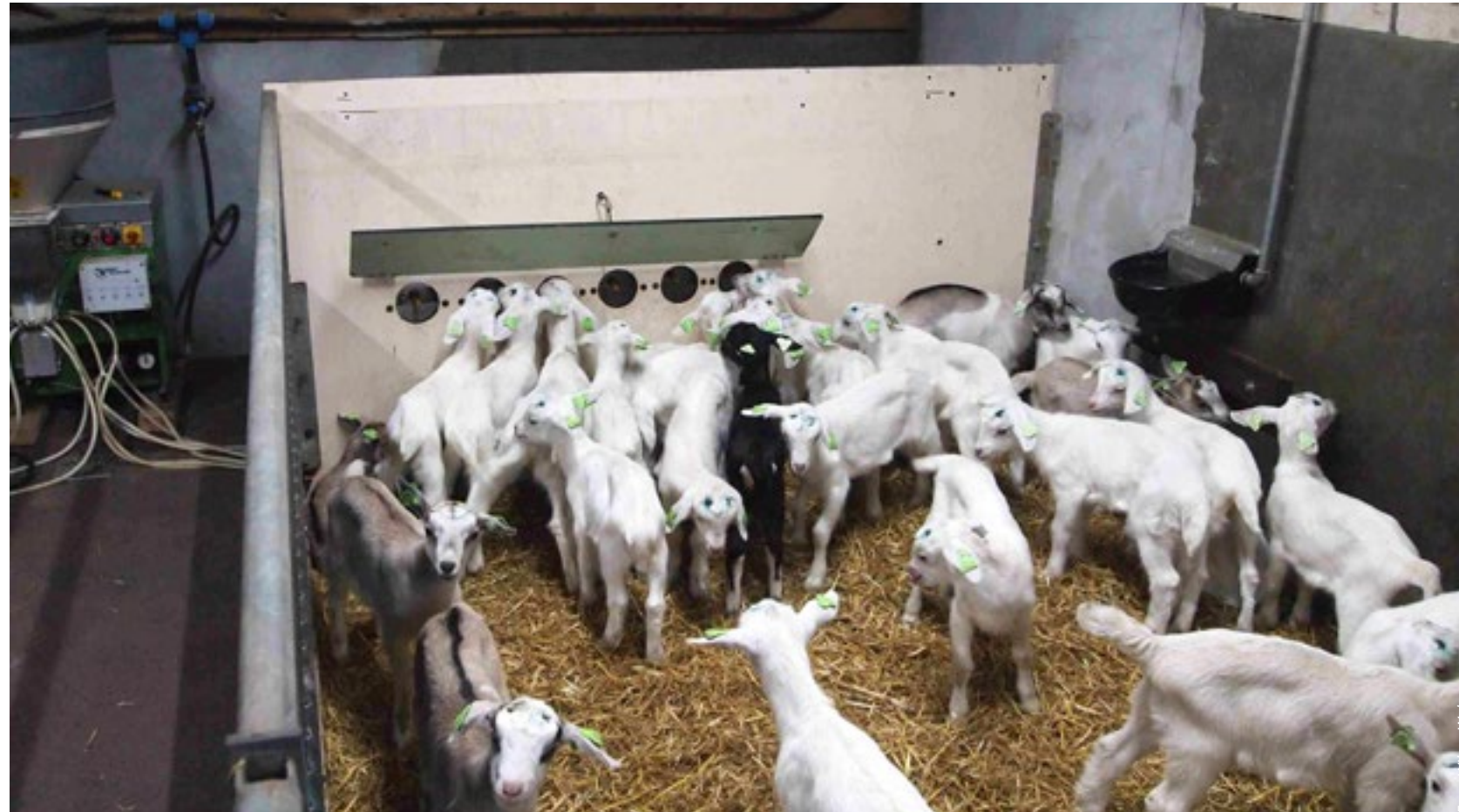
Lammeren grootbrengen is geen kleinigheid. Beperken in melkgift kan positief zijn voor hun gezondheid.

Beperkt en soms ook individueel melk verstrekken aan lammeren gebeurt steeds meer. Het lijkt de oplossing om de gevreesde spendip te voorkomen. Maar hoe pas je dit goed toe?