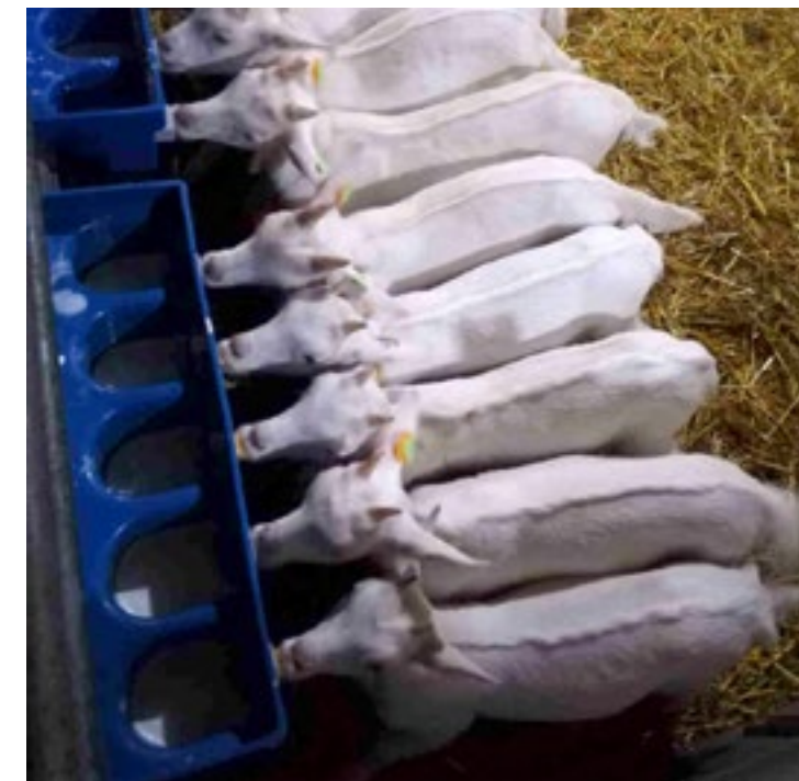
Beperkt melk voeren werkt het best als de groep lammeren van gelijk gewicht is.

ren die nagenoeg geen ruw- en krachtvoer opnemen, vertonen na het spenen een grotere groei dip.