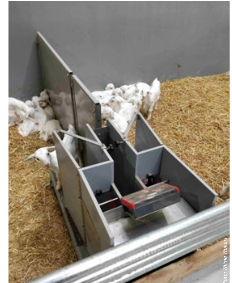
De melkgift beperken kan op verschillende manieren.

V akblad Geitenhouderij wijdde er half september een studiedag aan: beperkt en individueel melk voeren. Zo'n zestig deelnemers luisterden in Bennekom of thuis vanachter het beeldscherm naar een handvol experts en bekeken video's van geitenhouders met ervaring met beperkt voeren. Lammetjes grootbrengen is geen sinecure. Veel geitenhouders hebben de ervaring dat het best een jaar of twee goed kan lopen, maar dat er zomaar een lammerperiode kan komen waarin het niet lekker loopt. Of ze hebben het gevoel dat het allemaal gewoon nét wat beter zou moeten kunnen. Een van de sprekers tijdens de studiedag, Henk van der Horst van Denkvit, sprak zijn bewondering uit voor geitenhouders waar de lammeren jaar in jaar uit goed