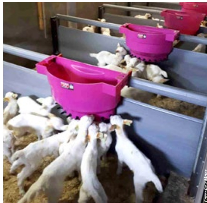
Bij beperkt melk voeren is naast afbouwen van melk het aanbieden van vers water van belang.

Een goede mengverhouding van poeder en melk en de juiste temperatuur. De opfokspecialisten noemden het tijdens de studiedag als voorwaarden om beperkt melk voeren goed toe te kunnen passen, en de twee drinkautomatenspecialisten die ook aanwezig waren, onderstrepen dat dit voorwaarden zijn voor een goede lammerdrinkautomaat. Erik Lambers van Breider Mechanisatie verkoopt de Urban drinkautomaat die lammeren individueel kan voeren, en Gerrit Aanstoot verkoopt drinkautomaten van Holm & Laue. Zij adviseren om een keer per maand, of bij een nieuwe levering van melkpoeder, de automaat te kalibreren, en daarbij ook de temperatuur te kalibreren. Ook het vervangen van slangen en speentjes verdient aandacht. Het is natuurlijk afhankelijk van hoeveel lammeren erop zitten, maar zij raden aan om gemiddeld eenmaal per maand de speentjes te vervangen. Tot slot dien je de automaat en de naaste omgeving daarvan regelmatig schoon te maken.