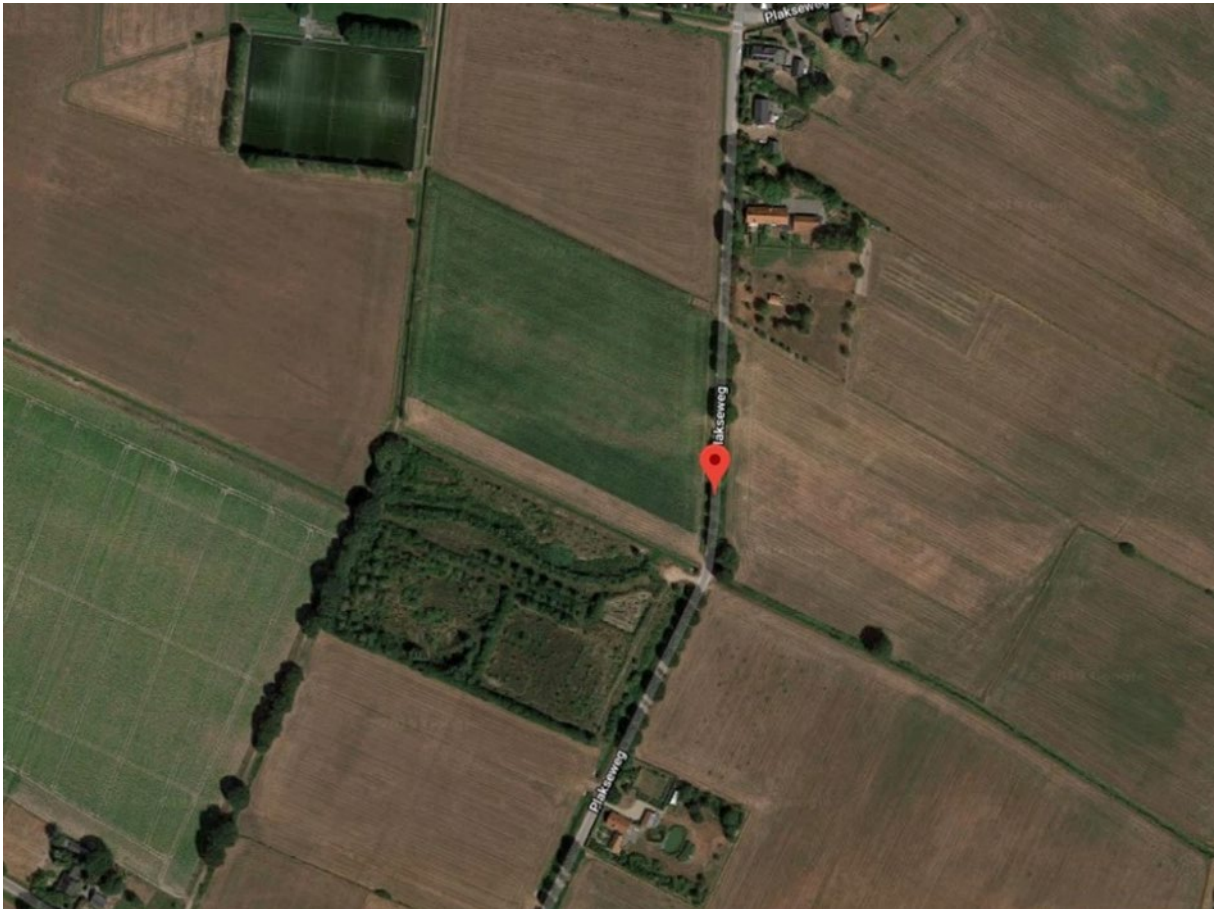
Luchtfoto voedselbos Ketelbroek in de zomer (2020) tijdens droogte. Eromheen liggen akkerbouwpercelen en een kunstgras sportveld

wordt er geen bodemleven verstoord. Dit komt de structuur van de bodem ten goede ( D'Haene et al., 2009 ).