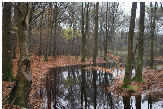
Afbeelding 1 Waterretentie bij Dwingelderveld

Er zijn Deltafacts beschikbaar over de rol van landgebruik in relatie tot zoetwatervoorziening, bodemaspecten en waterbeheer in de stad. Deze Deltafact biedt hierop een aanvulling door naar landgebruiksvormen te kijken waar bomen en houtige gewassen centraal staan in plaats van eenjarige gewassen.