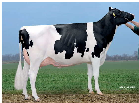
Drouner AJDH Aiko rf (v. Freddie), AV 87 Levensproductie: 25.000 4,90 3,81