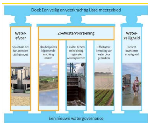
Figuur 2-1: De vijf hoofdlijnen van de strategie voor het IJsselmeergebied.

Dit heeft in 2015 geleid tot een strategie voor het IJsselmeergebied bestaande uit vijf samenhangende hoofdlijnen (zie figuur 2-1). Het centrale doel is: Een veilig en veerkrachtig IJsselmeergebied. Een veerkrachtig IJsselmeergebied bereiken we alleen als we alle vijf hoofdlijnen in onderlinge samenhang bezien en benaderen. De Deltabeslissing Waterveiligheid is een generieke Deltabeslissing. De Deltabeslissing IJsselmeergebied 2015 gaat over waterafvoer in combinatie met peilbeheer en over zoetwatervoorziening. De hoofdkeuzes zijn d.d. 4 april 2019 door het Bestuurlijk Platform IJsselmeergebied herbevestigd.