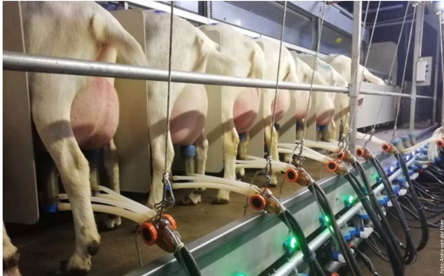
Een beeld in de melkstal van Harm en Ankie van der Veen-Meijer na een huiskeuring.