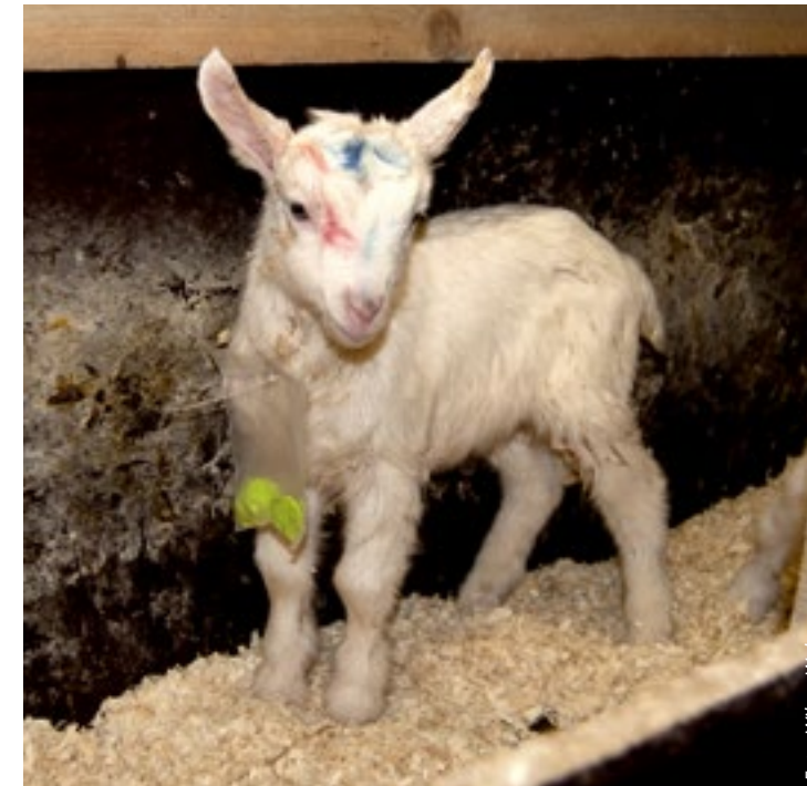
62 procent van de geitlammeren krijgt het oormerk binnen een week aangebracht.