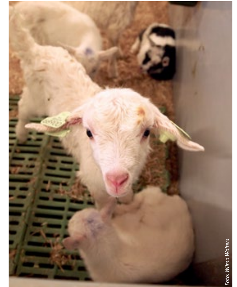
Uit oogpunt van dierenwelzijn geldt: hoe ouder de dieren zijn bij het aanbrenge van oormerken, hoe beter.

J e kunt oormerken oerlelijk vinden of dieronvriendelijk en het een vervelend klusje vinden om ze aan te brengen, maar als geitenhouder ontkom je er bijna niet aan om deze plastic herkenningsmiddelen bij je dieren te gebruiken. Feit is dat een geit in Nederland twee identificatiemiddelen moet hebben en dat je voor een elektronisch middel al snel op een oormerk uitkomt. Vakblad Geitenhouderij deed een enquête uit met vragen over het gebruik van de verschillende merken oormerken. We ontvingen 82 volledig ingevulde enquêtes terug. Het blijkt dat er inderdaad geitenhouders zijn die oormerken enkel en alleen aanbrenge omdat het een verplichting is. Het meest gekozen doel is echter toch de dieradministratie; dat geldt voor 96 procent van de respondenten. Het registreren van de melkgift en het uitselcteren van dieren zijn ook belangrijk en worden beide