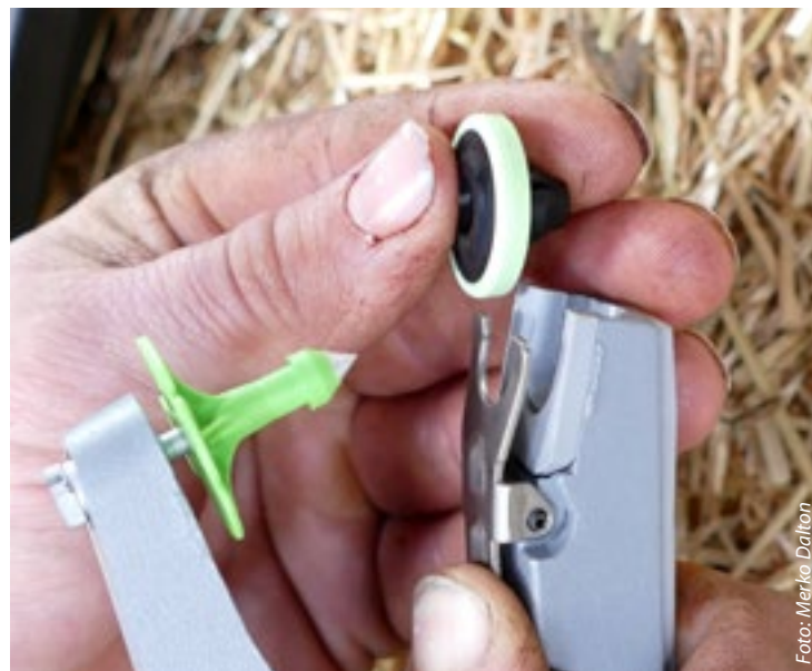
De oormerken netjes aanbrengen, op de juiste plek, verdient aandacht van de geitenhouder.