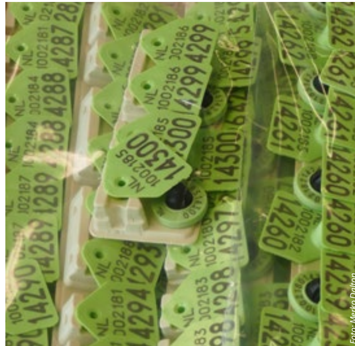
De respondenten van de enquête geven alle oormerken een ruime voldoende.