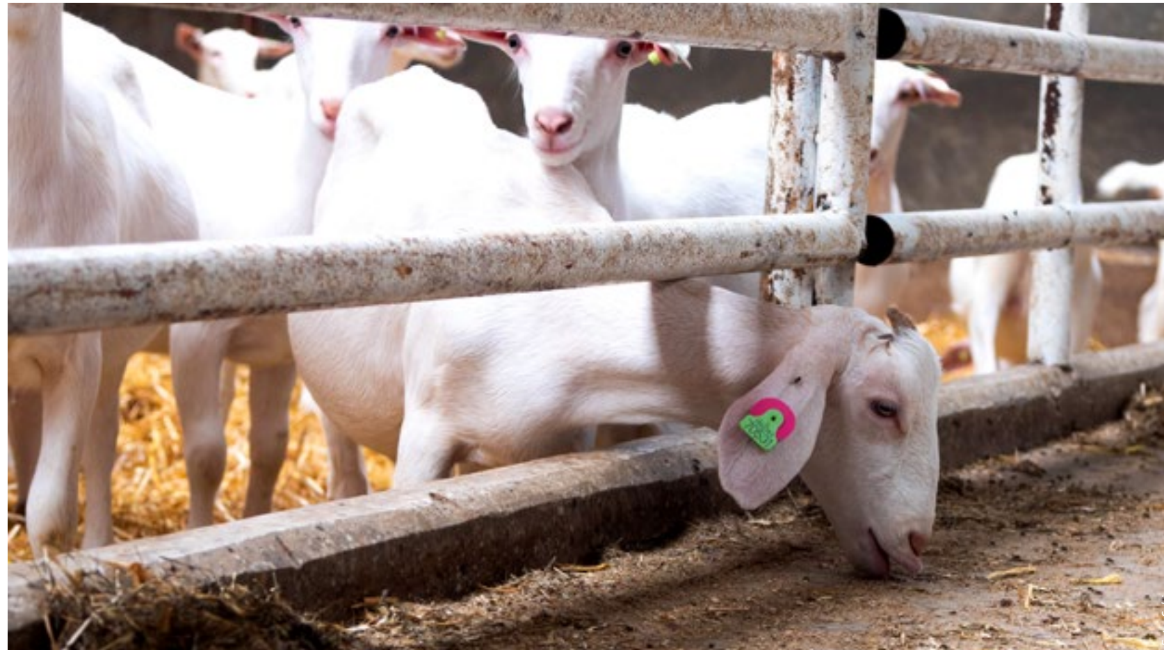
De mening van geitenhouders over een oormerk loopt nogal uiteen. Dat geldt voor alle merken.

Het verlies van een oormerk, zeker het elektronische, is lastig, en het inknippen van een vervangend merk kost tijd. Maar het verliezen lijkt erbij te horen, en komt met alle typen oormerken voor.