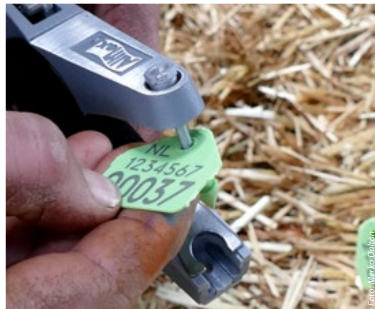
Schoon en hygiënisch werken bij het aanbrengen van oormerken, kan ontstekingen voorkomen.