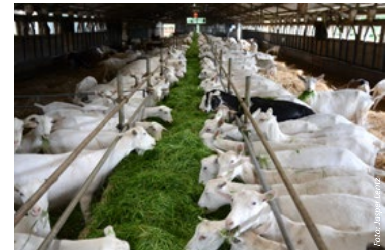
Op de centrale voergang krijgen de 400 geiten vers gras.