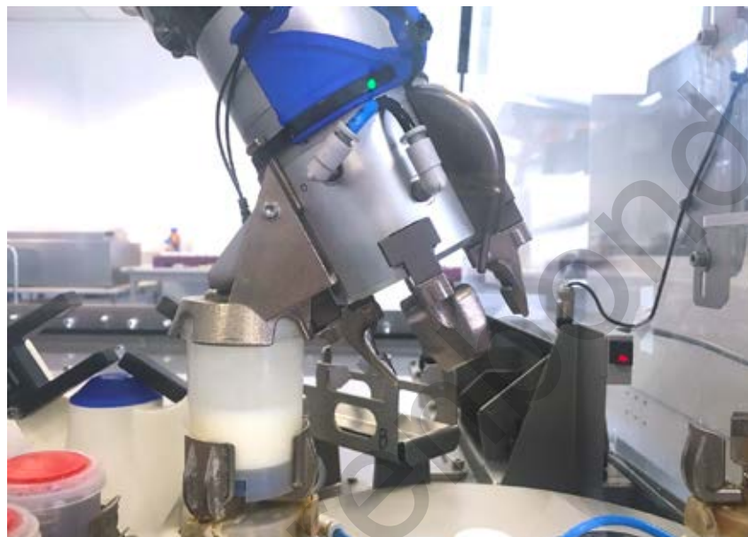
Een staal bevat maar 30 tot 40 cc melk. MCC moet nauwkeurig werken, want op basis daarvan wordt de melk uitbetaald.

Het jaarverslag vermeldt 748 bedrijfsbezoeken. “We hadden 84 dynamische metingen van melkinstallaties”, licht Jean-Marie toe. “Dat cijfer ligt een stuk lager dan het jaar voordien, door de sterke verbetering van het celgetal. Er werden vorig jaar 137 nieuwe melkinstallaties opgeleverd. We hebben daarin een heel sterke kennis opgebouwd en kunnen een neutrale positie innemen ten opzichte van de installateurs. Er waren 275 bezoeken in het kader van procedure 020, bij overschrijdingen van parameters zoals kiem- en celgetal. Ook dat cijfer is iets lager dan in 2018, doordat er minder overschrijdingen waren. Onze buitendienstmedewerkers overlopen samen met de melkveehouder een checklist. Bij de vierde overschrijding