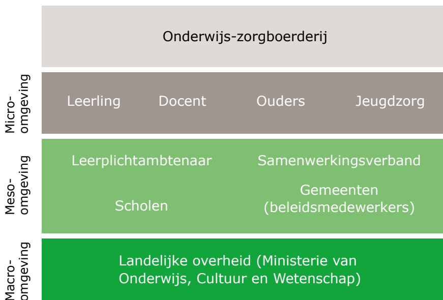
Figuur 1: Betrokken stakeholders

Ongeveer de helft van de onderwijs-zorgboeren geeft aan dat het onderwijs gefinancierd wordt door gemeenten. De andere helft ontvangt een vorm van financiering vanuit het onderwijs (via school of samenwerkingsverband).