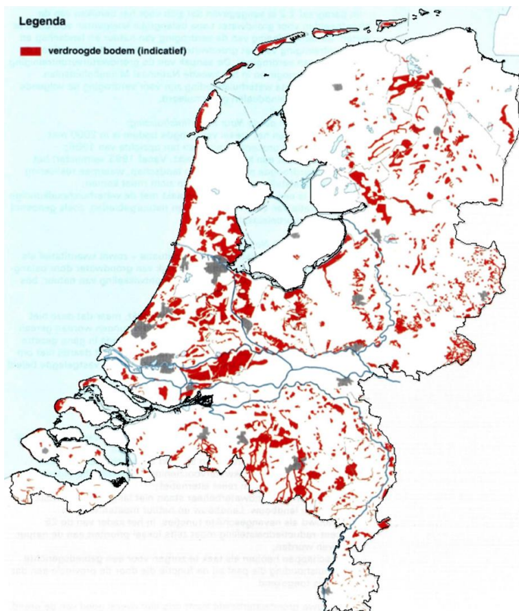
Afbeelding 2 De eerste landelijke kaart met verdroogde natuurgebieden (Rijkswaterstaat, 1994)

behalen van deze doelstelling wordt grotendeels aan de provincies overgelaten; het Rijk beperkt zich tot coördinatie en verstrekking van subsidies. In een druk bezocht symposium over de verdroging wordt geconcludeerd dat oplossingen in “ constructief overleg met en samenwerking van alle betrokkenen gevonden moeten worden ” en dat aanpassingen in het belang van natuur en landschap alleen maar kunnen worden doorgevoerd “ als daarmee door alle belanghebbenden wordt ingestemd, en dat kan nog wel eens problemen geven ” (CHO-TNO, 1991). Er wordt getwijfeld of de doelstelling voor 2000 gehaald wordt, maar de symposiumvoorzitter adviseert “ gewoon te beginnen en door te gaan, ondanks een zowel horizontaal als verticaal gebrekkige coördinatie ”. In 1994 volgt een evaluatienota (Rijkswaterstaat, 1994) waarin zorgen worden geuit over het niet halen van de doelstelling. Om het proces vlot te trekken geeft de nota een ‘werkbare’ definitie van verdroging (die in de laatste alinea van de vorige paragraaf is aangehaald) en presenteert het een kaart met alle verdroogde natuurgebieden in Nederland (afbeelding 2). Er zal een omslag moeten plaatsvinden en de ambitie wordt nu om het verdroogde oppervlak voor 2010 met 40% te verkleinen (Ministerie van VROM, 1997).