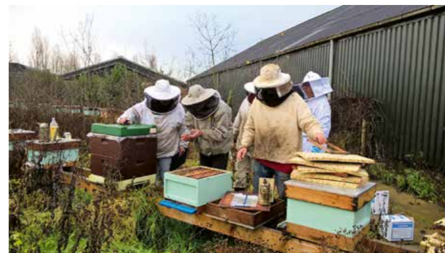
Bij elkaar in de keuken kijken.

** Op locatie met andere regulier gehouden volken