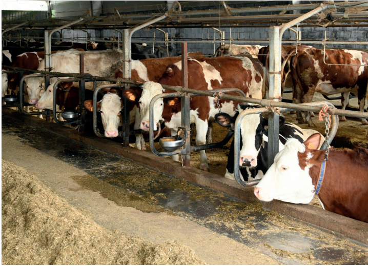
De vijftig melkkoeien staan in de winter op de grupstal