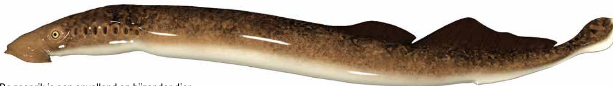
De zeeprik is een opvallend en bijzonder dier.

buikholte van de proefdieren worden ingebracht en uit meer dan zestig detectiestations op strategische locaties in de Rijn en de Maas. Wanneer een gezenderde vis een detectiestation passeert, wordt deze geregistreerd waarna de gegevens worden doorgestuurd naar een centrale database. Analyse op basis van het unieke ID-nummer van elke vis resulteert in een tijdreeks met daaraan gekoppeld de verschillende locaties die de vis tijdens zijn migratie is gepasseerd. Zo worden zowel de route als de migratiesnelheid inzichtelijk. In 2018 voerde adviesbureau ATKB in opdracht van Rijkswaterstaat