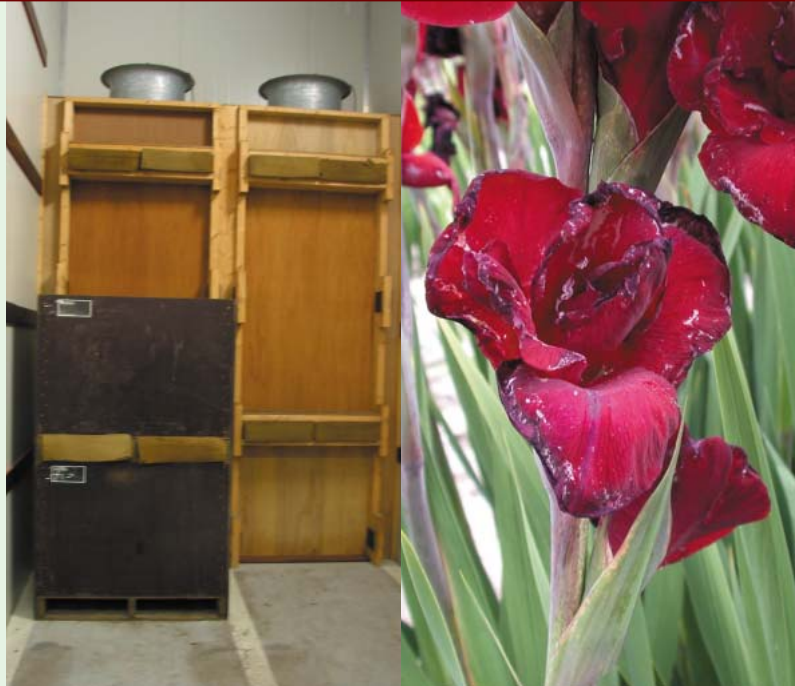
Links: Palletkast bewaar ruimte voor bloembollen; Rechts: Door trips aangetaste gladiolenbloemen.