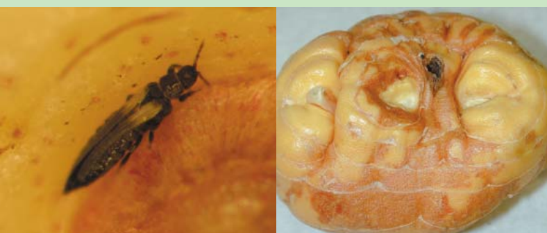
Boven: Effect van een regelmatige ruimtebehandeling op het % knollen met levende trips en % met door trips beschadigde knollen; Linksonder: Gladiolentrips; Rechtsonder: Door trips aangetaste gladiolenknol.