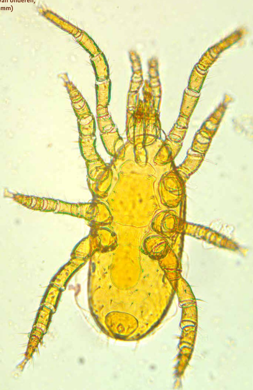
Hypoaspis praesternalis (roofmijt van onderen, lengte 0.4 mm)