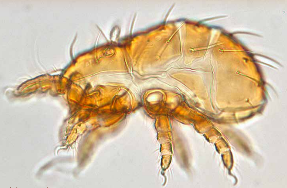
Liochthonius neglectus (mosmijt van opzij, lengte ca. 0.180 mm)

In figuur 2 staan de voedselgildes van microarthropoden. Hier zien we wel een groot verschil met de bodemfauna van beukenbossen. Op de vogelkerslocaties is het totaal aan obligate schimmeleeters 36, 24 en 29% (Ossenberg, Johannahoeve en Loonse en Drunense duinen). Voor de beukenbossen zijn die getallen 68, 70 en 64% (Loenense, Ugchelense en Hoenderlose bos). De vogelkerslocaties hebben daarentegen vooral een groter deel omnivoren: 12 tot zelfs 37%, terwijl dat in beukenbossen nooit meer dan 10% is. Ook de herbivoren zijn veel talrijker in de vogelkersopstanden (16 tot 31%), terwijl ook die in de beukenopstanden nauwelijks boven de 10% uitkomen. In absolute zin vinden we de grootste afname