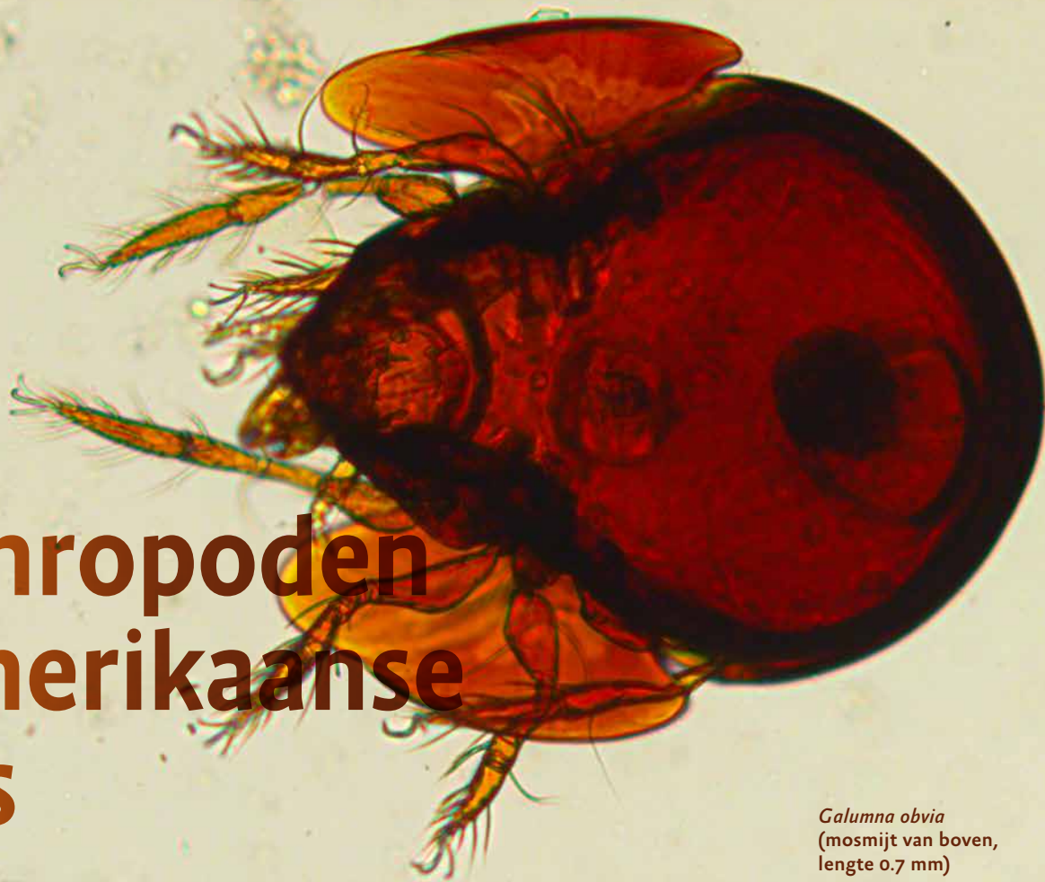
Galumna obvia (mosmijt van boven, lengte 0.7 mm)