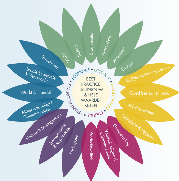
Figuur 1. Duurzaamheidsbloem van IFOAM's toekomstvisie Organic 3.0, zie www.ifoam.bio

visie Organic 3.0, beschrijft de wereldkoepelorganisatie van de bio sector (IFOAM) duurzaamheidsaspecten waarbij het niet alleen gaat om ecologische veerkracht maar ook om maatschappelijke veerkracht. Zonder gedeelde maatschappelijke waarden komen we niet tot integrale duurzaamheid! In de visie van de Raad voor Integrale Duurzame Landbouw en Voeding (RIDLV, 2011) wordt de vraag gesteld waarom het in Nederland zo moeizaam lukt om tot integrale duurzaamheid te komen. De raad stelt dat een belangrijke oorzaak te weinig aandacht krijgt: onze voedselproductie is losgemaakt uit zijn ecologische en sociale context. Hierdoor raken vitale relaties verloren of zijn deze zelfs gecorrumpceerd. Consumenten, producenten en alle ketenpartijen daartussen voelen nog amper verantwoordelijk voor elkaar met als gevolg een toenemende afstand en vervreemding tussen de schakels in de voedselketen. Zelfs als elke schakel ultiem zijn best zou doen te verduurzamen dan nog worden er links of rechts in de keten zaken over de schutting gegooid omdat hij/zij zich daar niet verantwoordelijk voor voelt. Op meerdere vlakken ontbreekt de regie in de keten. En dit leidt tot wat de RIDLV 'georganiseerde onverantwoordelijkheid' noemt.