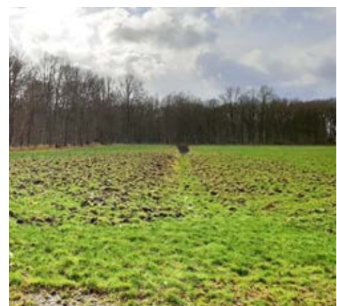
Mais en grasland dat ten prooi viel aan wilde zwijnen.