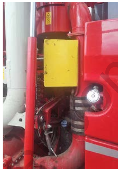
De NIR-sensor wordt gemonteerd op de losbuis van het uitrijvoertuig en meet continu de mestsaamenstelling.

Om deze nieuwe technieken te integreren in de praktijk moeten er nog enkele uitdagingen worden aangepakt. Een belangrijke uitdaging bij het gebruik van een NIR-sensor om de mestsaamenstelling te meten is de nauwkeurigheid en kalibratie van deze meting. Het is momenteel nog onvoldoende duidelijk met welke nauwkeurigheid de mestsaamenstelling kan worden gemeten, waardoor de techniek in de praktijk nog maar zeer beperkt wordt toegepast in Vlaanderen. Ook voor het afbakenen van managementzones binnen percelen moet bijkomend onderzoek nog meer duidelijkheid brengen. De komende jaren zullen KU Leuven, BDB en Hooibeekhoeve