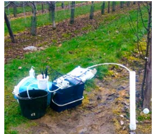
Bemonstering van een peilbuis in de fruitaanplanting.

In 2017 en 2018 werden in Halen vier verschillende schema's vergeleken (zie tabel). De behandelingen gebeurden in beide jaren op dezelfde rijen, zodat we op dit moment de effecten van twee jaar kunnen waarnemen. Dit is belangrijk omdat de behandeling cumulatief werkt. De bodemvoorraad N kan na enkele jaren veranderen, wat een invloed kan hebben op groei, opbrengst en vruchtkwaliteit. De proef ligt op een lichte zandleembodem, het perceel is voorzien van irrigatie. De teler geeft jaarlijks 50 eenheden N onder de vorm van mengmest (februari) en ook 30 eenheden N onder de vorm van \text{Ca}(\text{NO}_3)_2 of KAS (kalkammonsalpeter). In de zomer worden nog 20 eenheden N bijgegeven (behandeling 1). In behandeling 2 werd de N-zomerbemesting weggelaten, wat resulteerde in een reductie van de N-gift met 20%. In